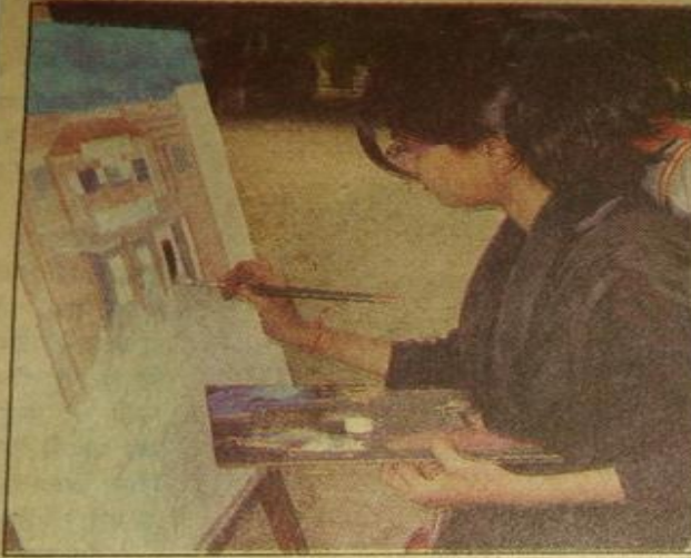
पेंटिंग बनाती छात्रा।