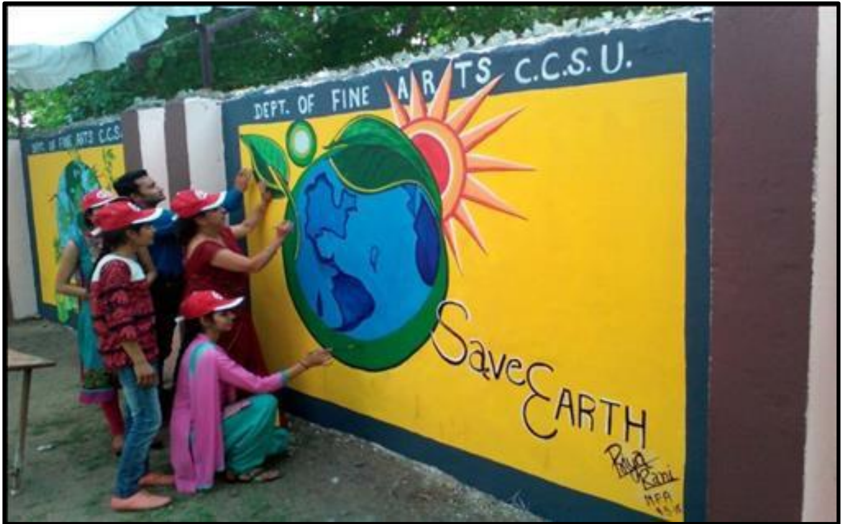
Canvas Painting On The Theme Save Earth 05 January 2018 Department Of Fine Arts