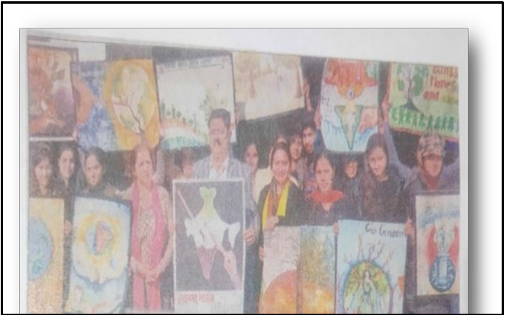
Awareness To Save Environment Through Poster 9 January 2019 Department Of Fine Department