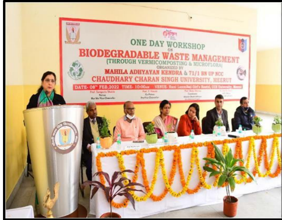
One Day Workshop on "Medicinal Plants and Their Utilities" And "Biodegradable Waste Management" 8 February 2022 Mahila Adhyayan Kendra