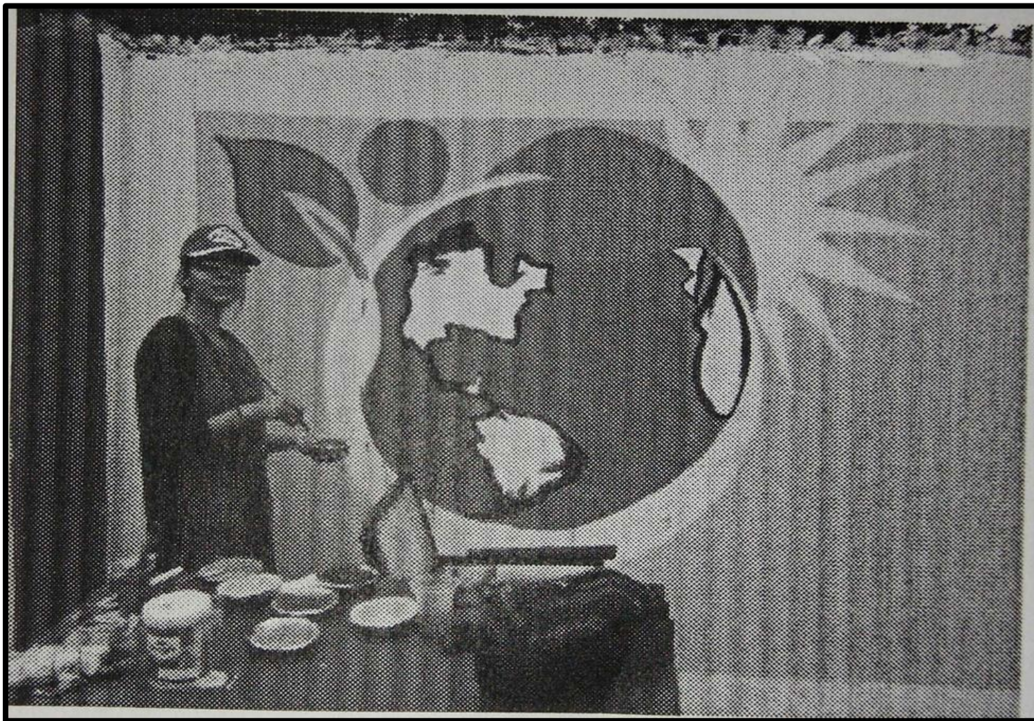
Poster Competition 21 December 2017 Department Of Fine Arts