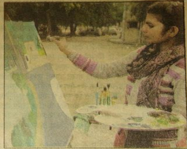
विवि में लैंड स्केप पेंटिंग बनाती छात्रा।