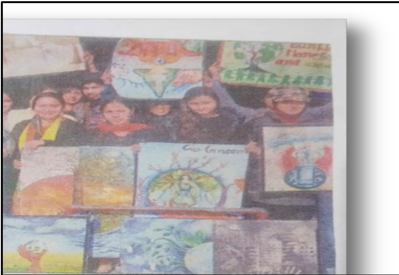
Awareness To Save Environment Poster Competition. 06 January 2018 Department Of Fine Art