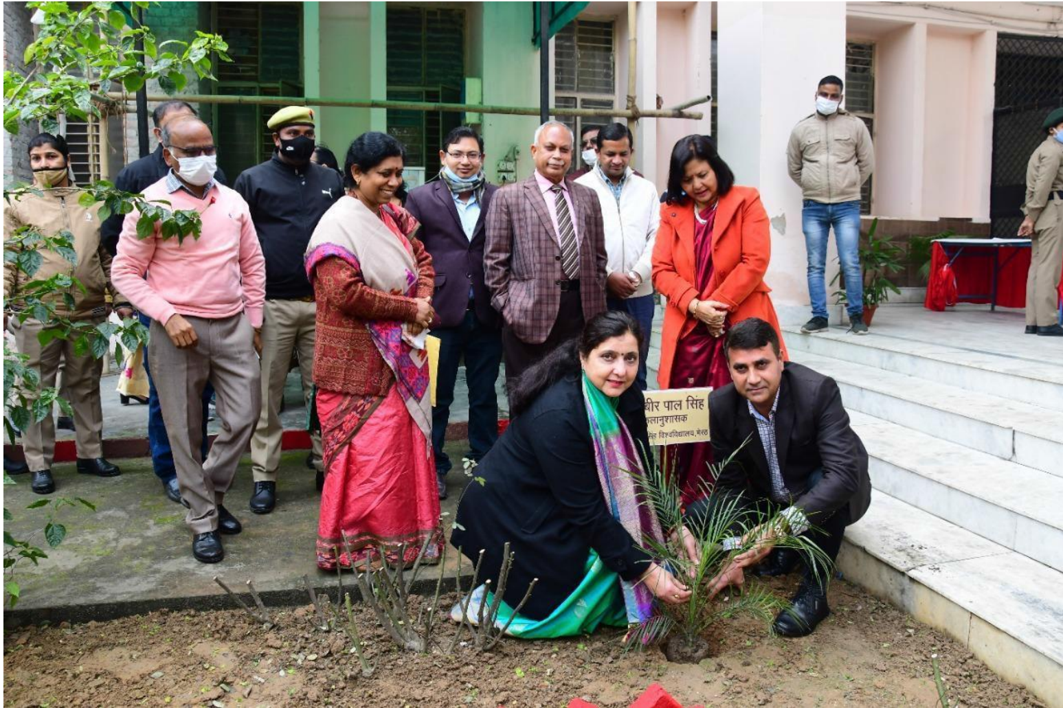
One Day Workshop on "Medicinal Plants And Their Utilities" And "Biodegradable Waste Management" 8 February 2022 Mahila Adhyayan Kendra