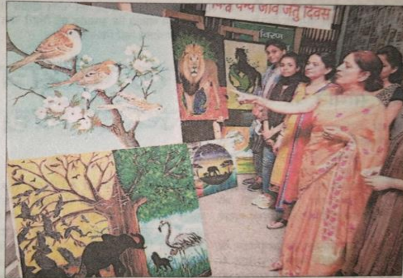
एनएएस कॉलेज में छात्रों की चित्रकारी का अवलोकन करतीं अतिथि।