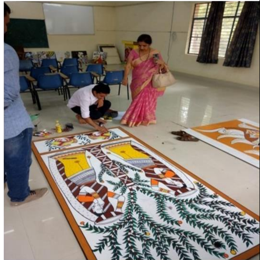
10 Days Workshop On Save Environment 1 May 2018 Department Of Fine Arts