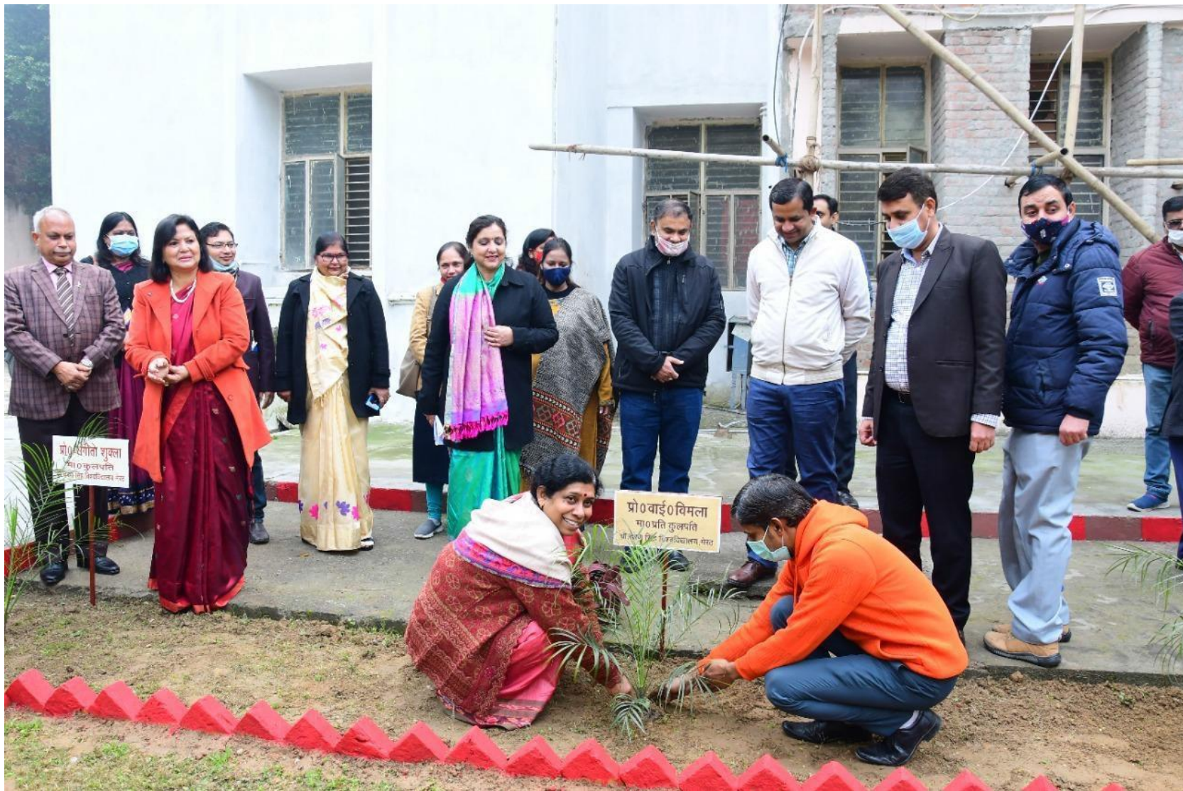
One Day Workshop on "Medicinal Plants And Their Utilities" And "Biodegradable Waste Management" 8 February 2022 Mahila Adhyayan Kendra