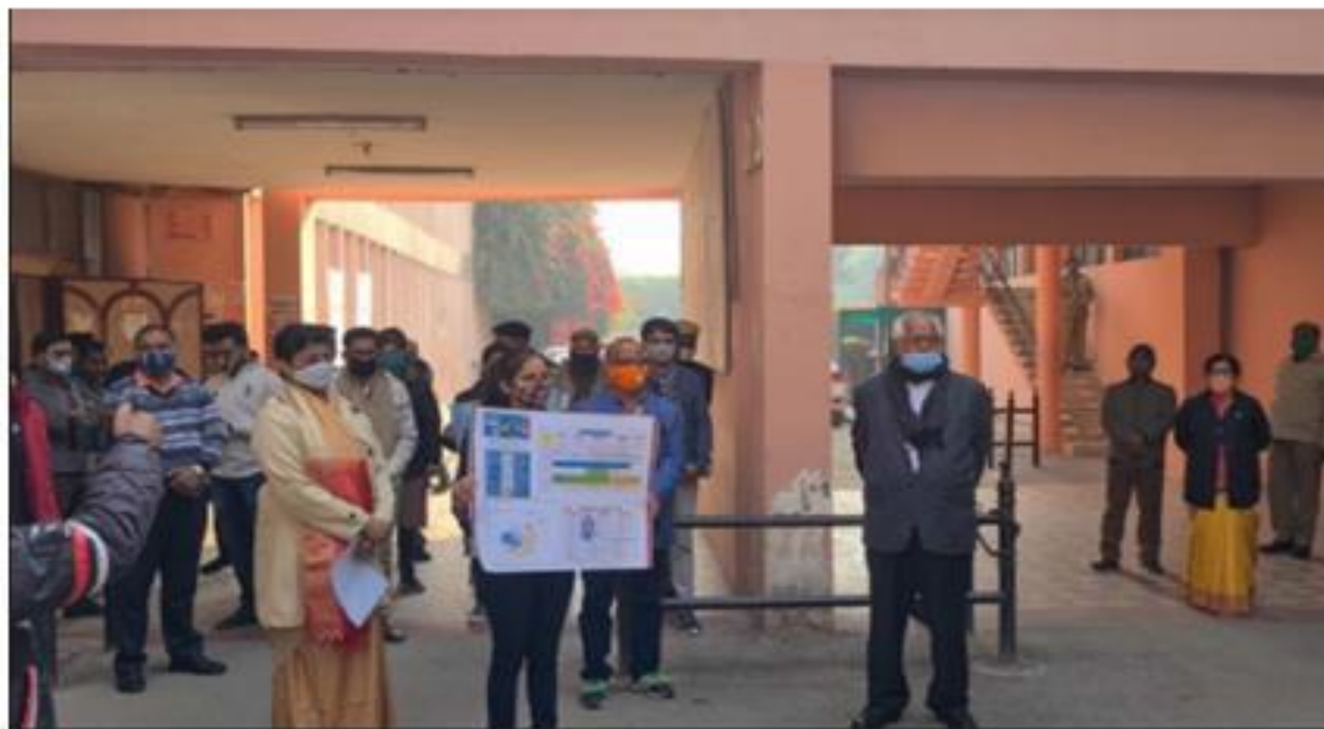
Campus drive by Eco club 23.12.20