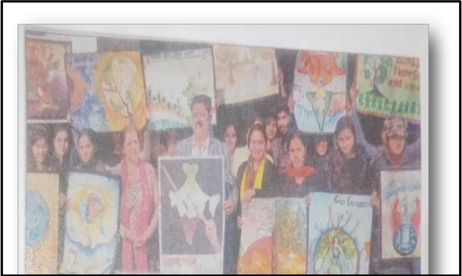
Awareness to Save Environment through Poster 9 January 2019 Department of Fine Department