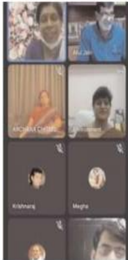
कक्षाओं में प्रकृति के किस्मे, पंचतंत्र में

उन्होंने कहा कि प्रकृति हमने रची बसी है इस बात पर जोर, वीरता