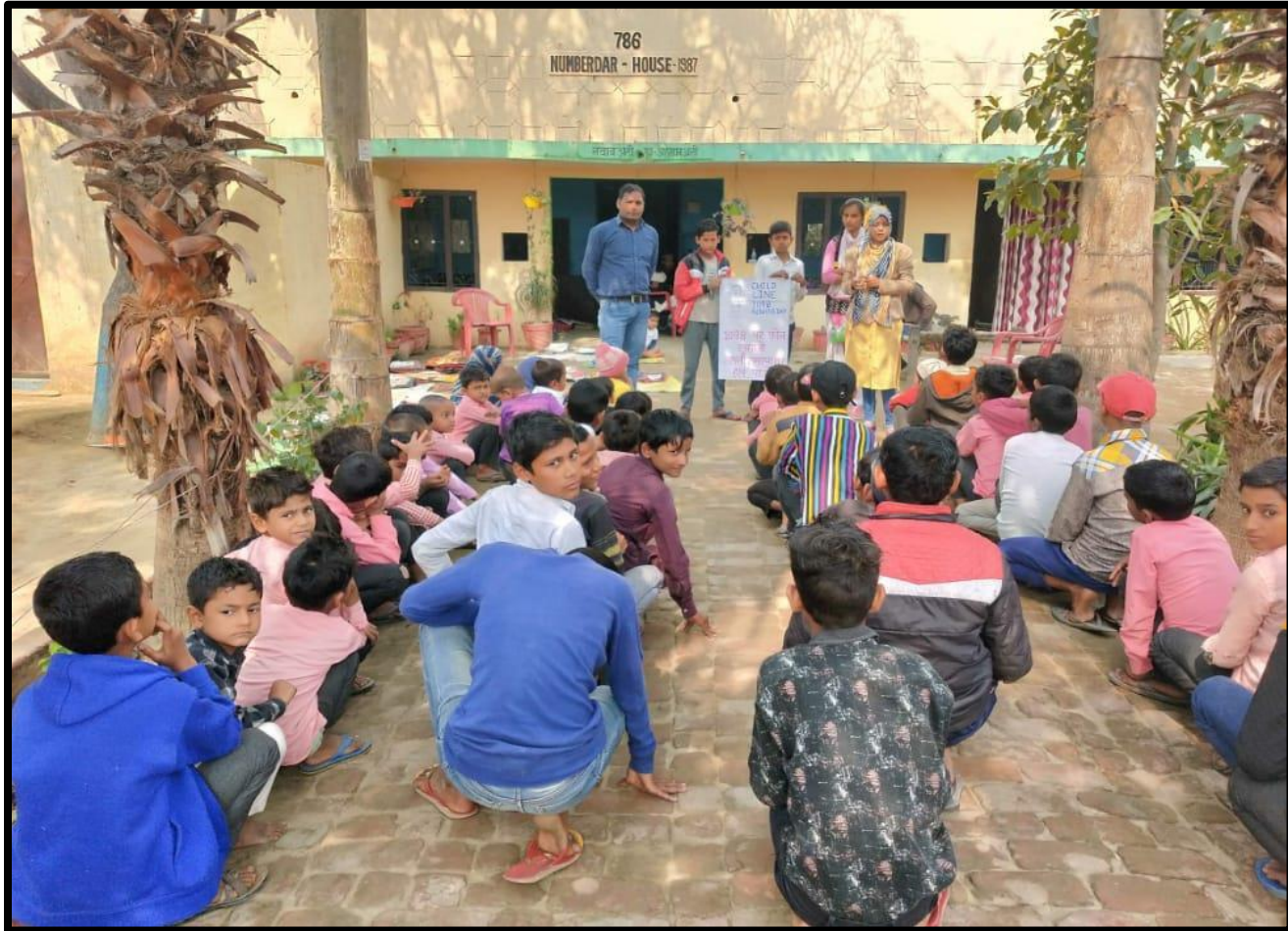
World Environment Day 5 June 2021 Department Of Sociology