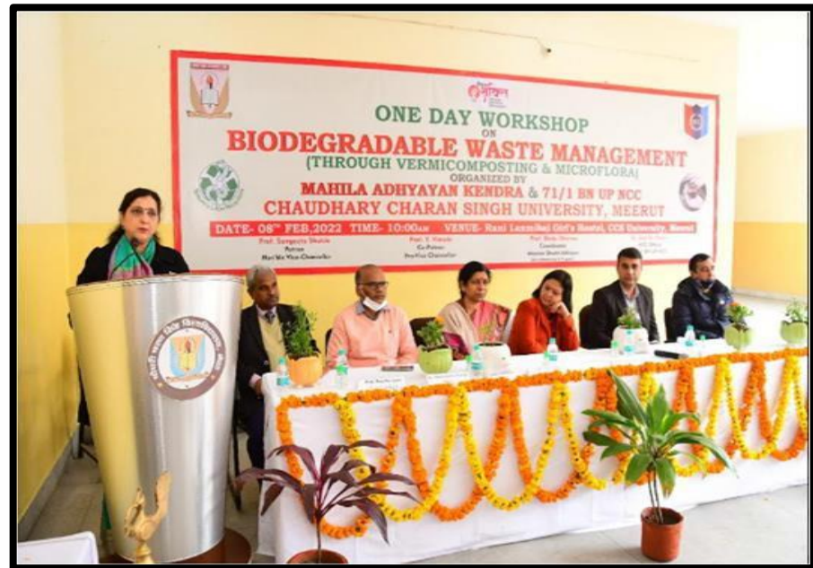
One Day Workshop “Medicinal Plants and Their Utilities and Biodegradable Waste Management” 8 February 2022 Mahila Adhyayan Kendra