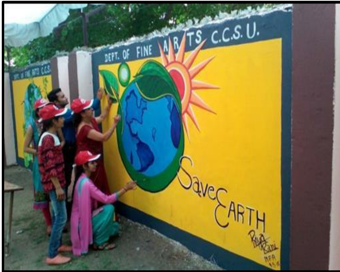
Canvas Painting on the Theme Save Earth 05 January 2018 Department Of Fine Arts