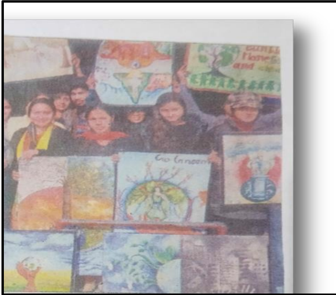
Poster Competition on Awareness to Save Environment 06 January 2018 Department Of Fine Arts