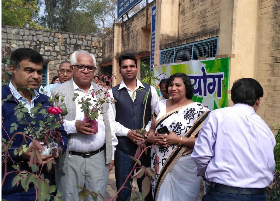
Plantation Drive 19 March 2017 Department Of Mathematics