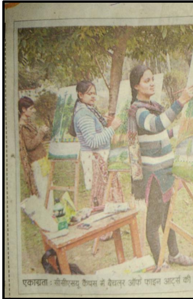
Save Environment Painting Exhibition 8 December 2017 Department Of Fine Arts