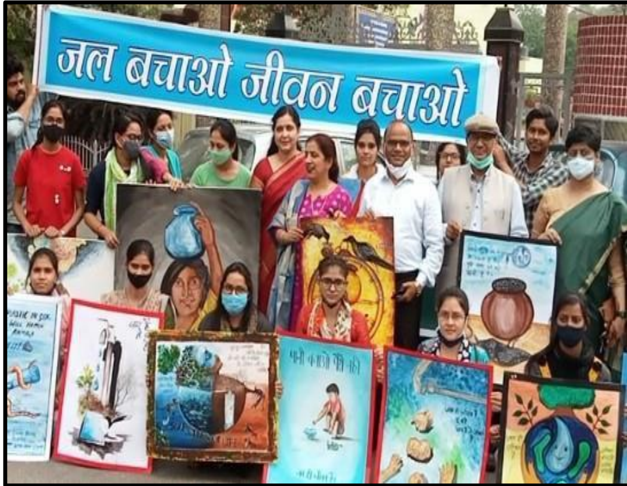
World Water Day by CCS University 22 March 2022