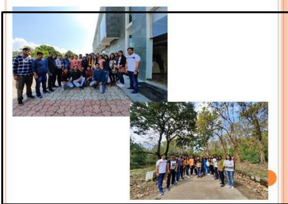
Environment Awareness Programme Visit To JIM CORBETT NATIONAL PARK 12-13 th March 2020 Department Of Commerce