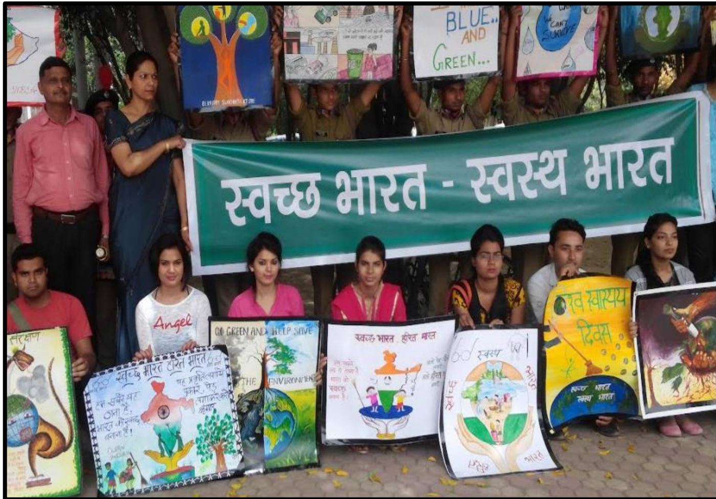
Awareness of Cleanliness the Environment 10 November 2021 Department of Fine Art