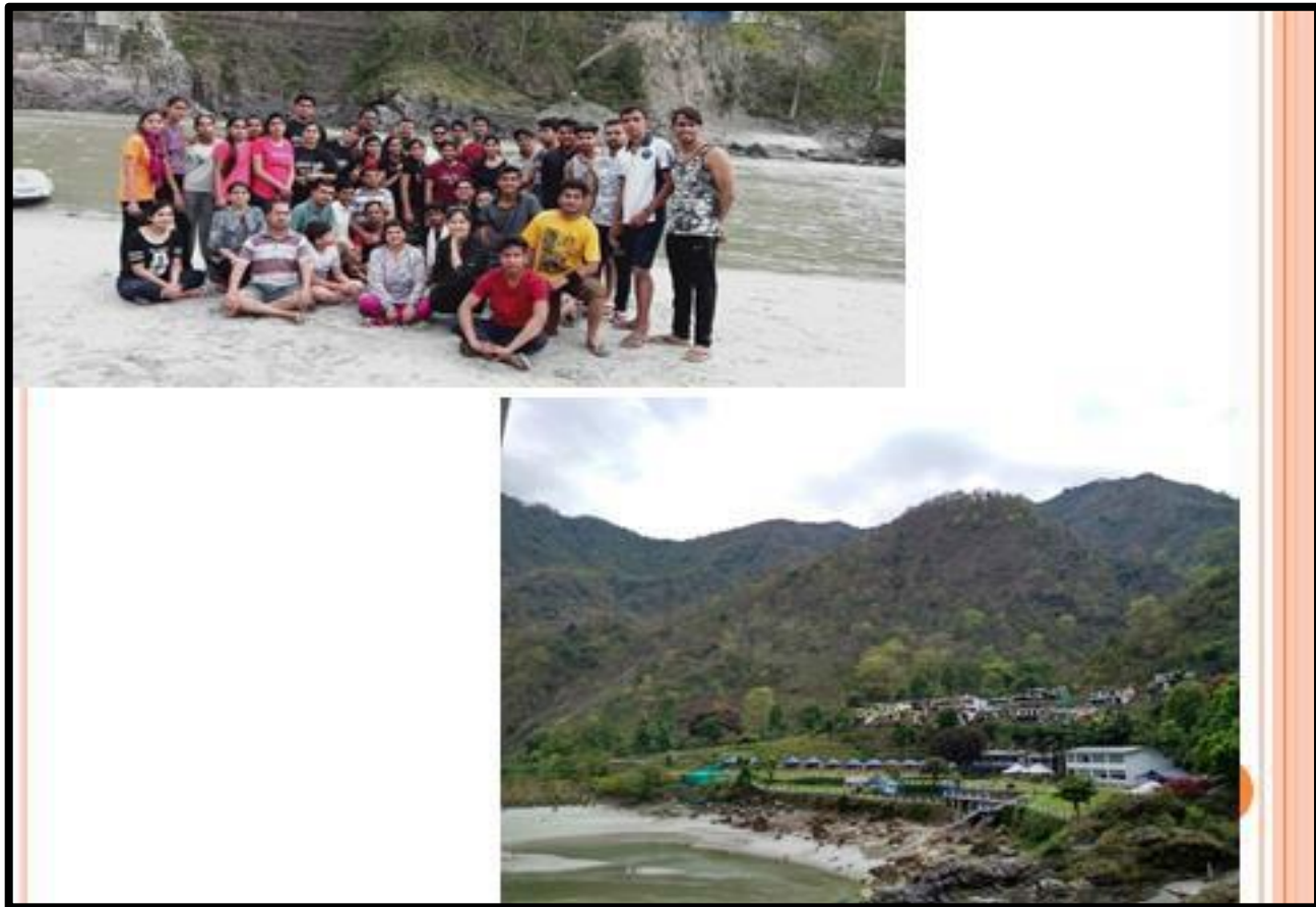
Awareness Programme on 'CLEAN GANGA' Visit To Rishikesh 20 April 2019 Department Of Commerce