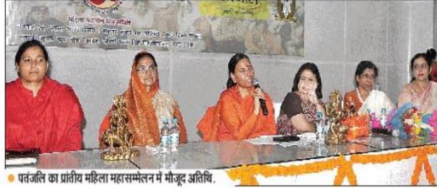
● पतंजलि का प्रांतीय महिला महासम्मेलन में मौजूद अतिथि.