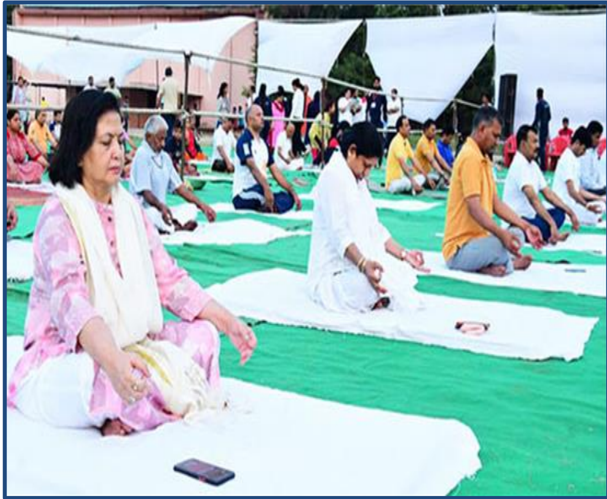
Celebration on Yoga Day 21-06-2022