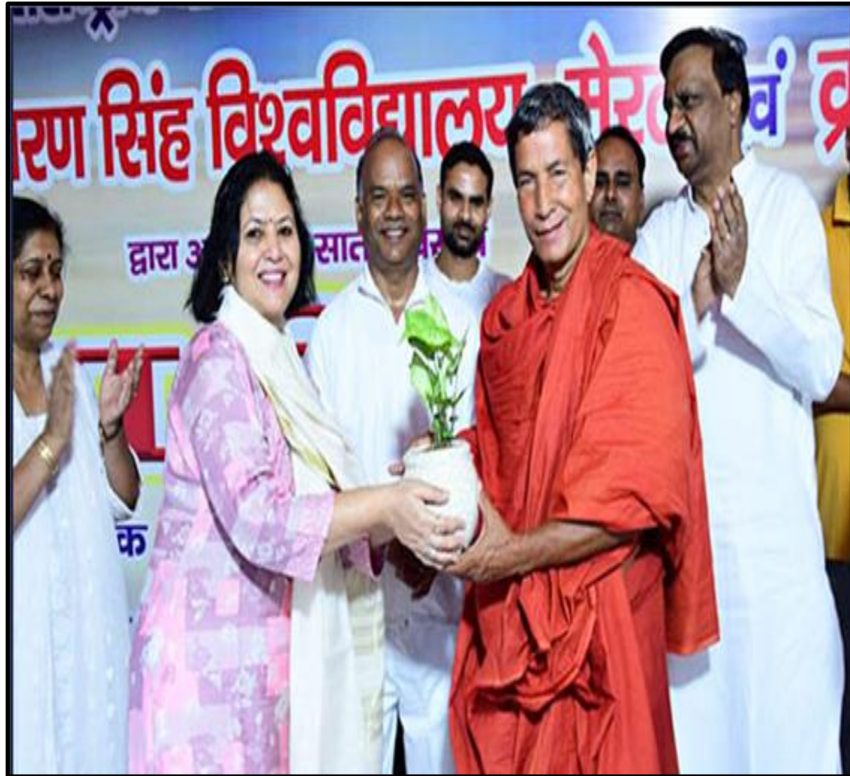
Celebration on Yoga Day 21-06-2022