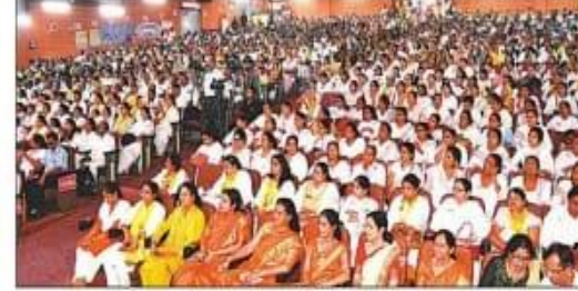
महिला सम्मेलन में मौजूद साध्वी और अन्य लोग। अप्र 23/22