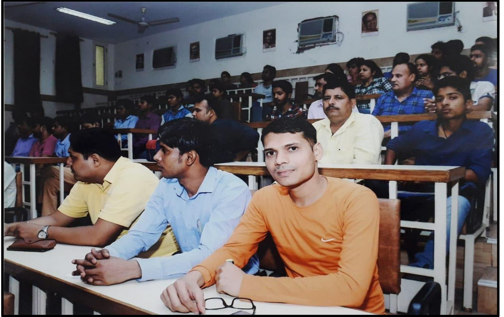
Seminar Under The University Foundation Day Celebration 30 th June – 01 st July 2018 Sahityik Sanskriti Parishad