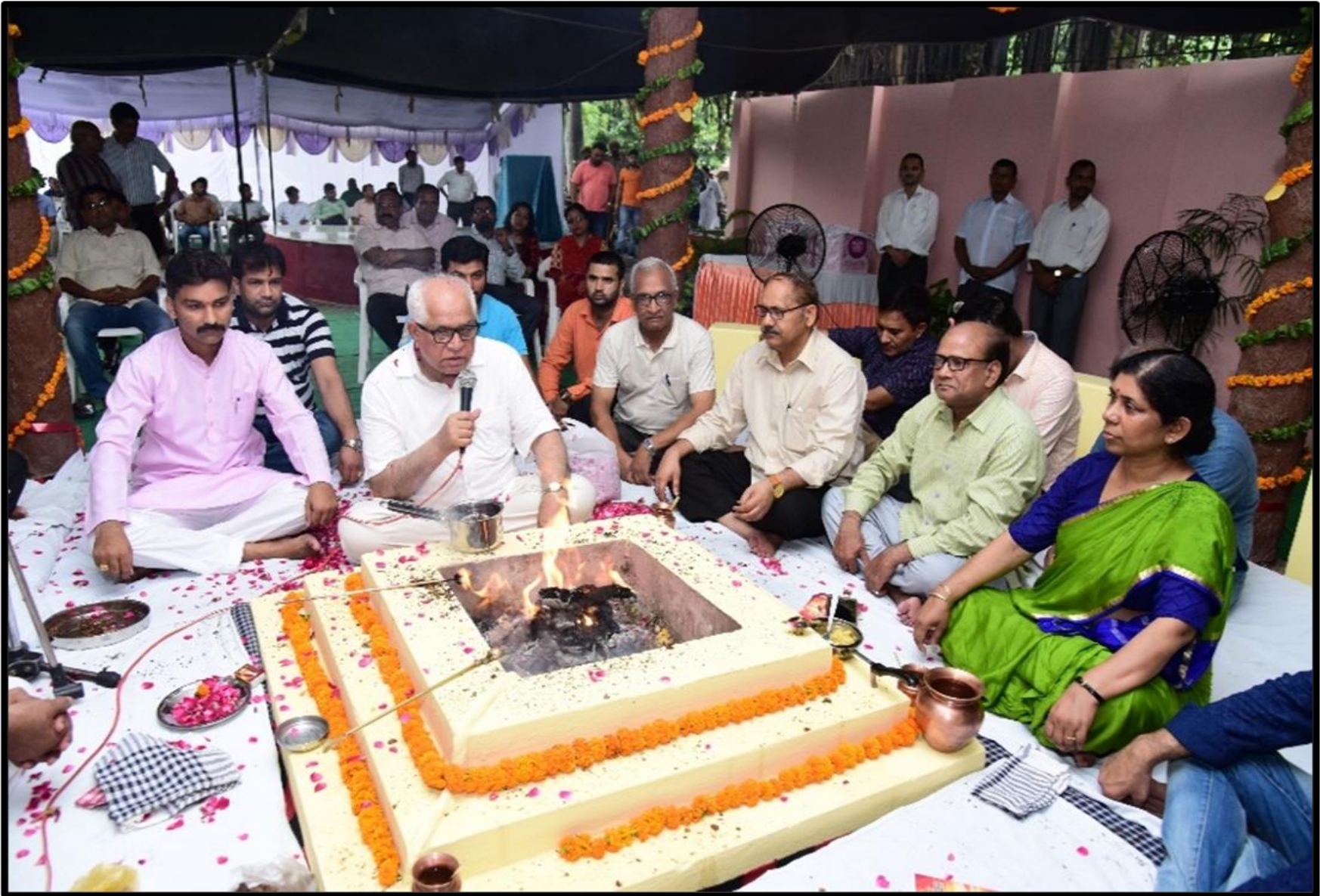
University Foundation Day 07-01-2018