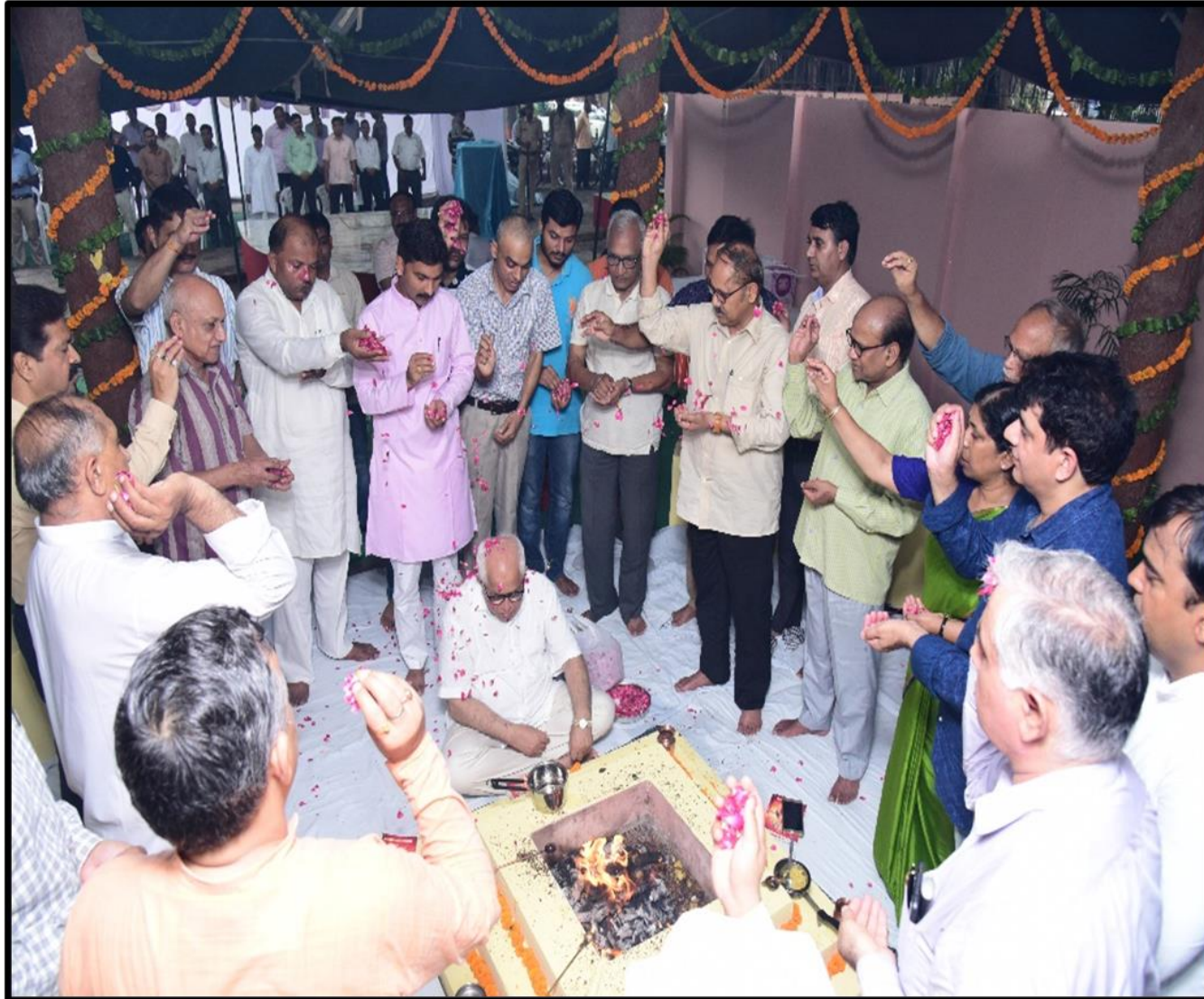
University Foundation Day 07-01-2018