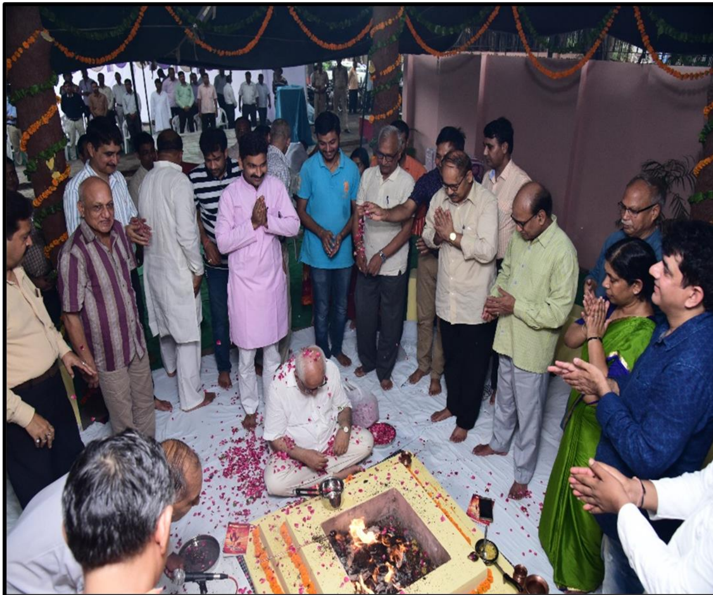
University Foundation Day 07-01-2018