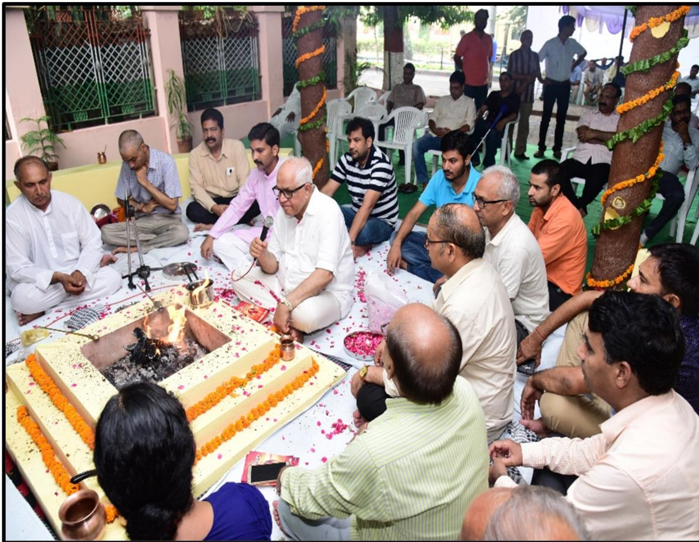
University Foundation Day 07-01-2018