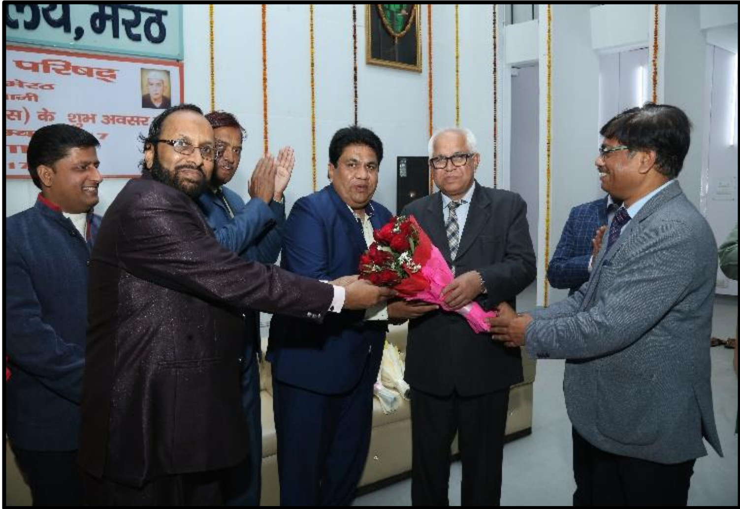
Late Chaudhary Charan Singh Jayanti 23-12-2017