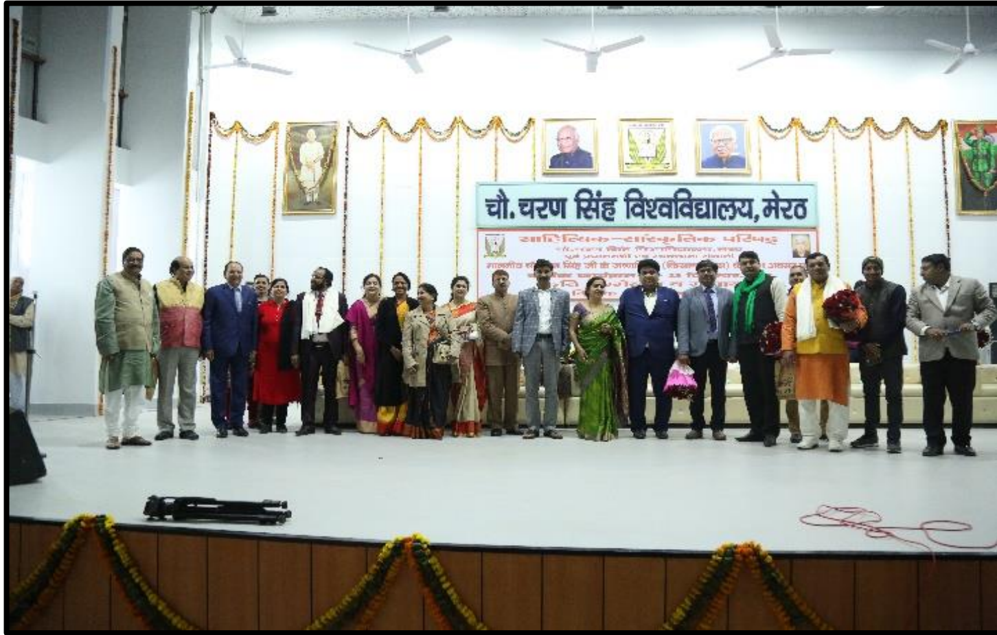
Late Chaudhary Charan Singh Jayanti 23-12-2017