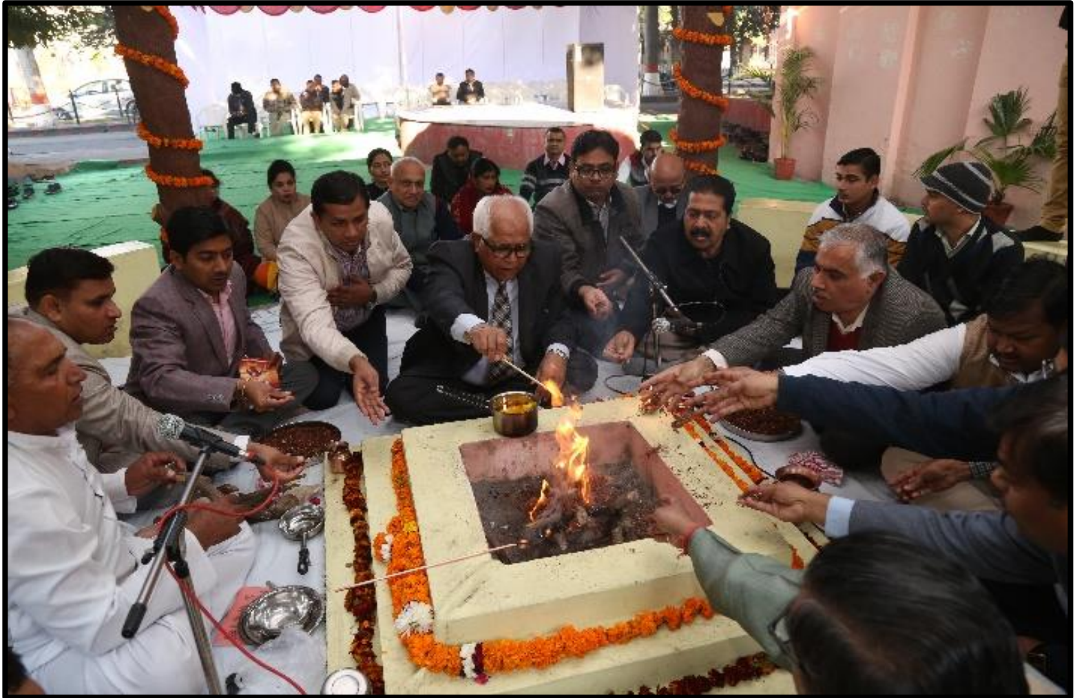
Late Chaudhary Charan Singh Jayanti 23-12-2017