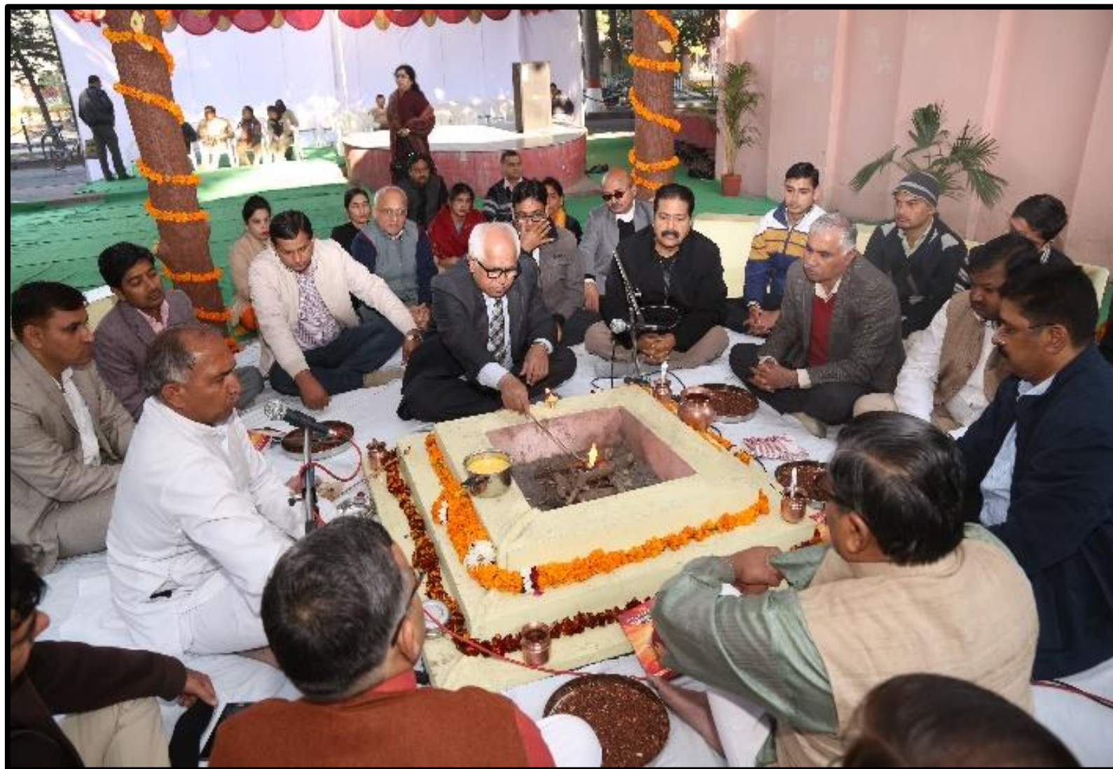
Late Chaudhary Charan Singh Jayanti 23-12-2017