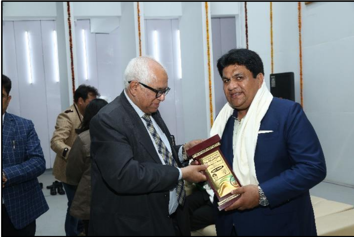
Late Chaudhary Charan Singh Jayanti 23-12-2017