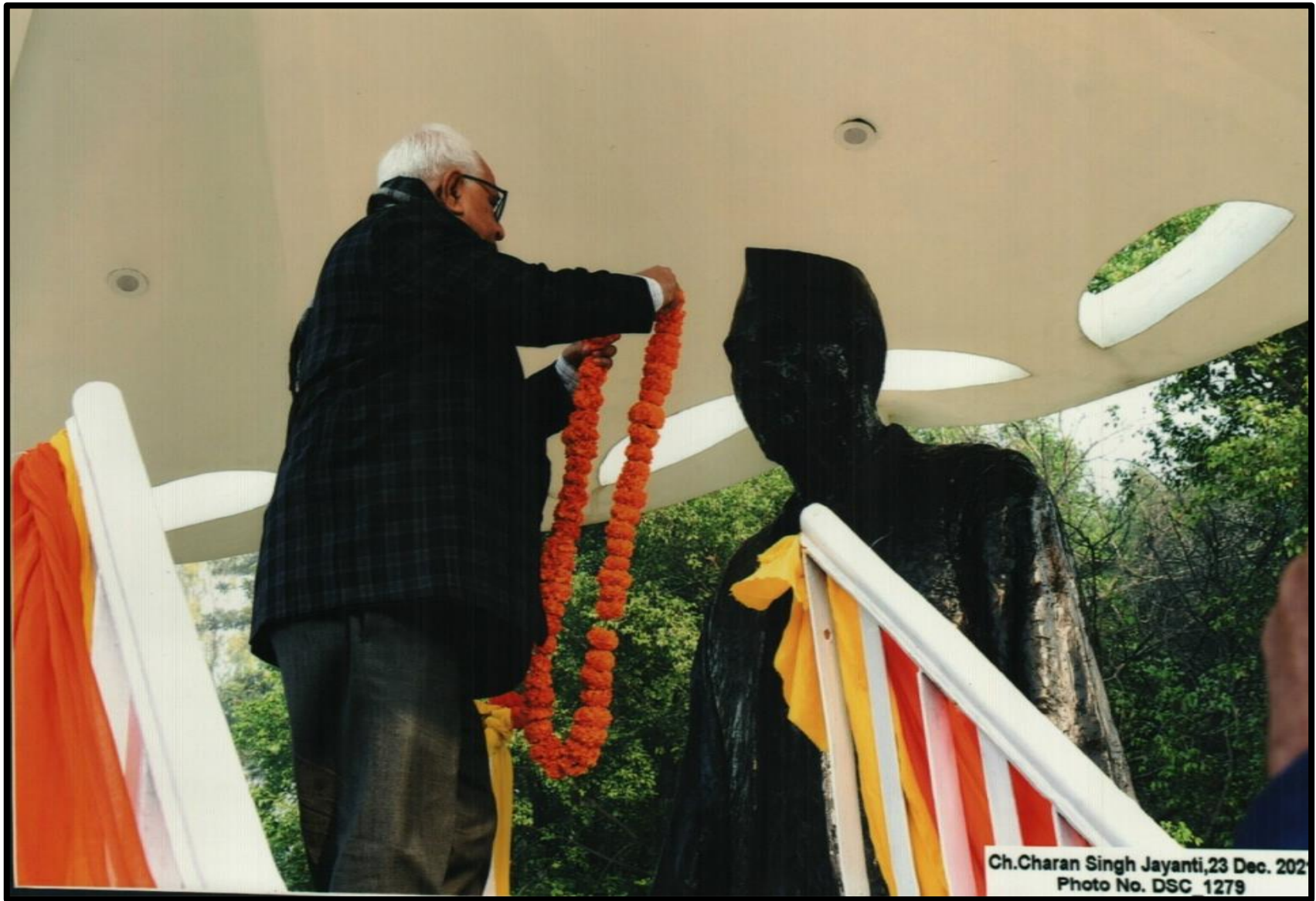
Late Chaudhary Charan Singh Jayanti 23 -12-2021