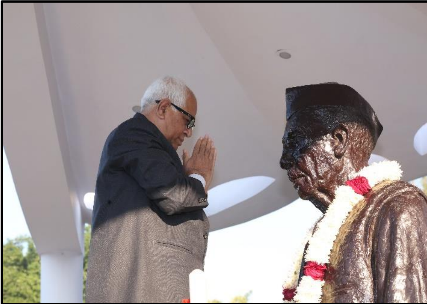
Late Chaudhary Charan Singh Jayanti 23-12-2017