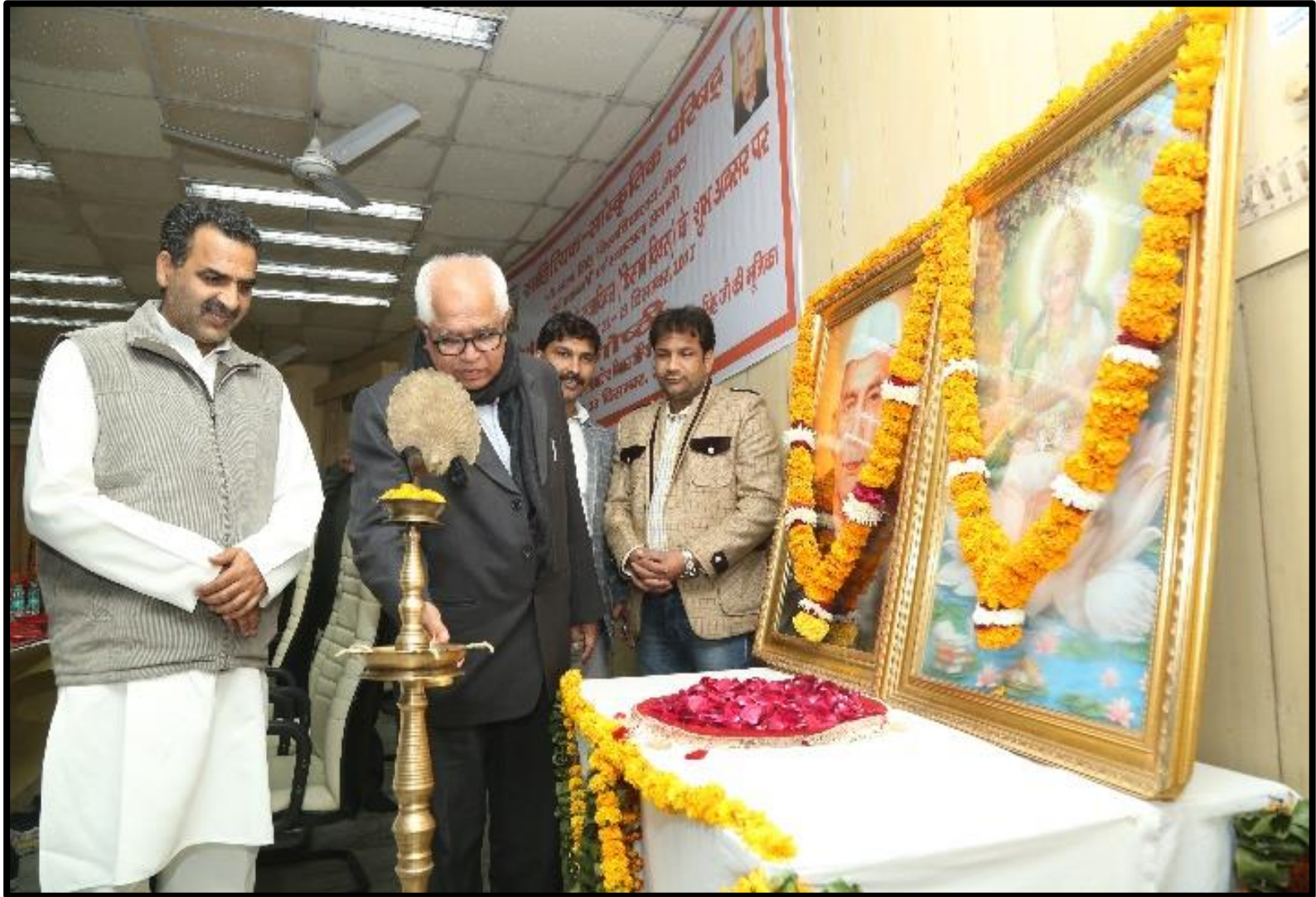
Late Chaudhary Charan Singh Jayanti 23-12-2017