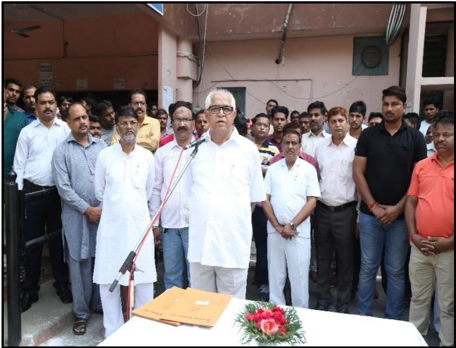
Independence day celebration in University campus 15-08-2017