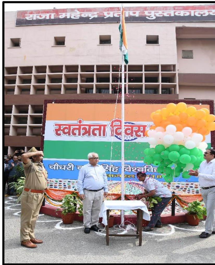
Independence Day Celebration in University Campus 15-08-2018