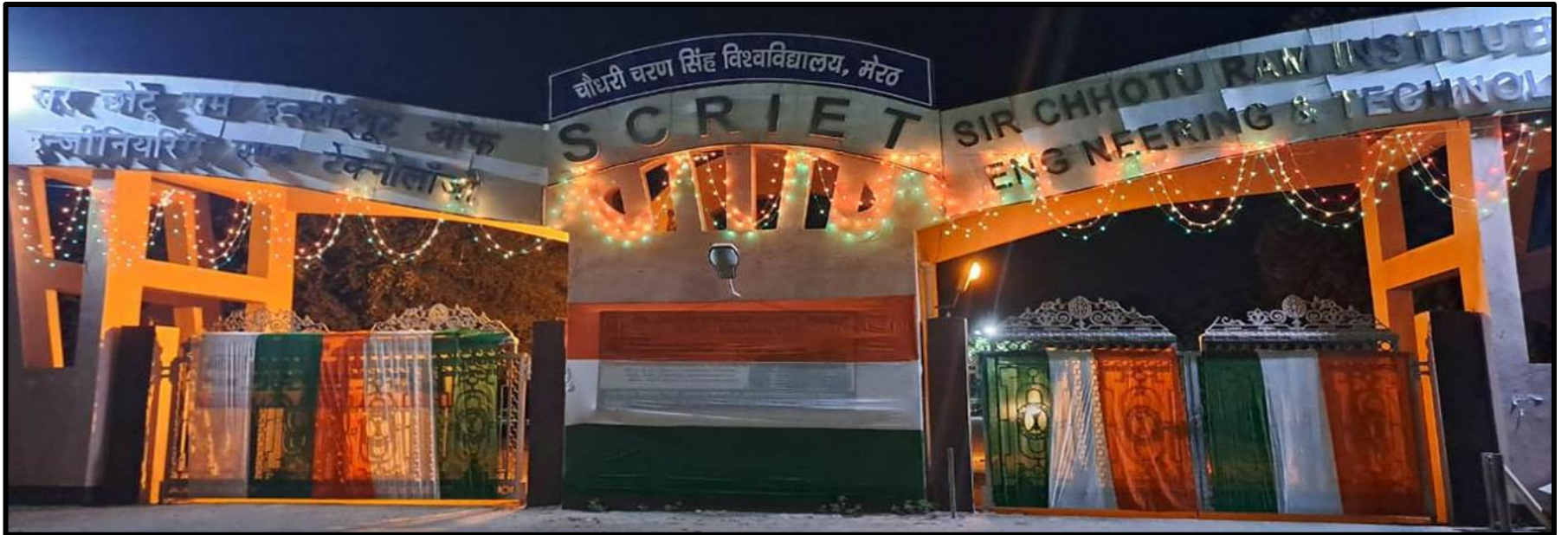
Decoration of SCRJET on the occasion of Independence day on 15-08-2022