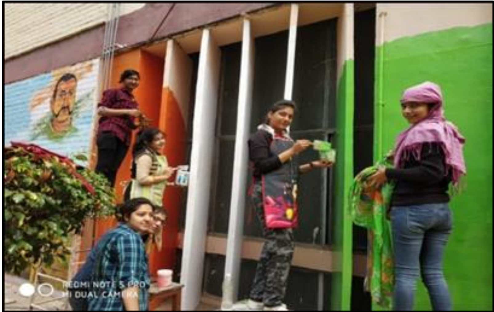
Graffiti of bravery and courage of soldiers on the walls of the campus independence day week March 2019 Department of Fine Arts