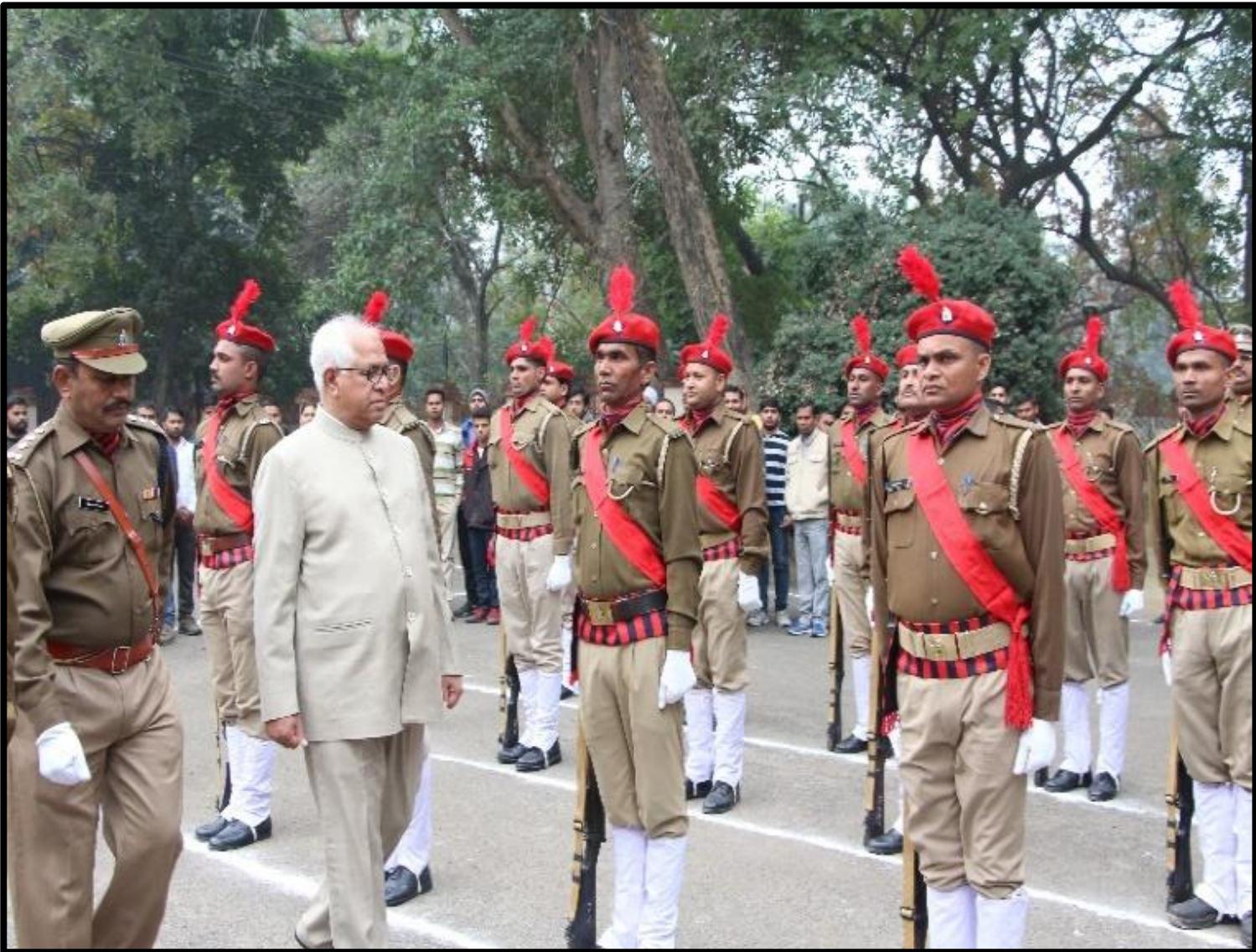
Independence Day Celebration in University Campus 26-01-2017