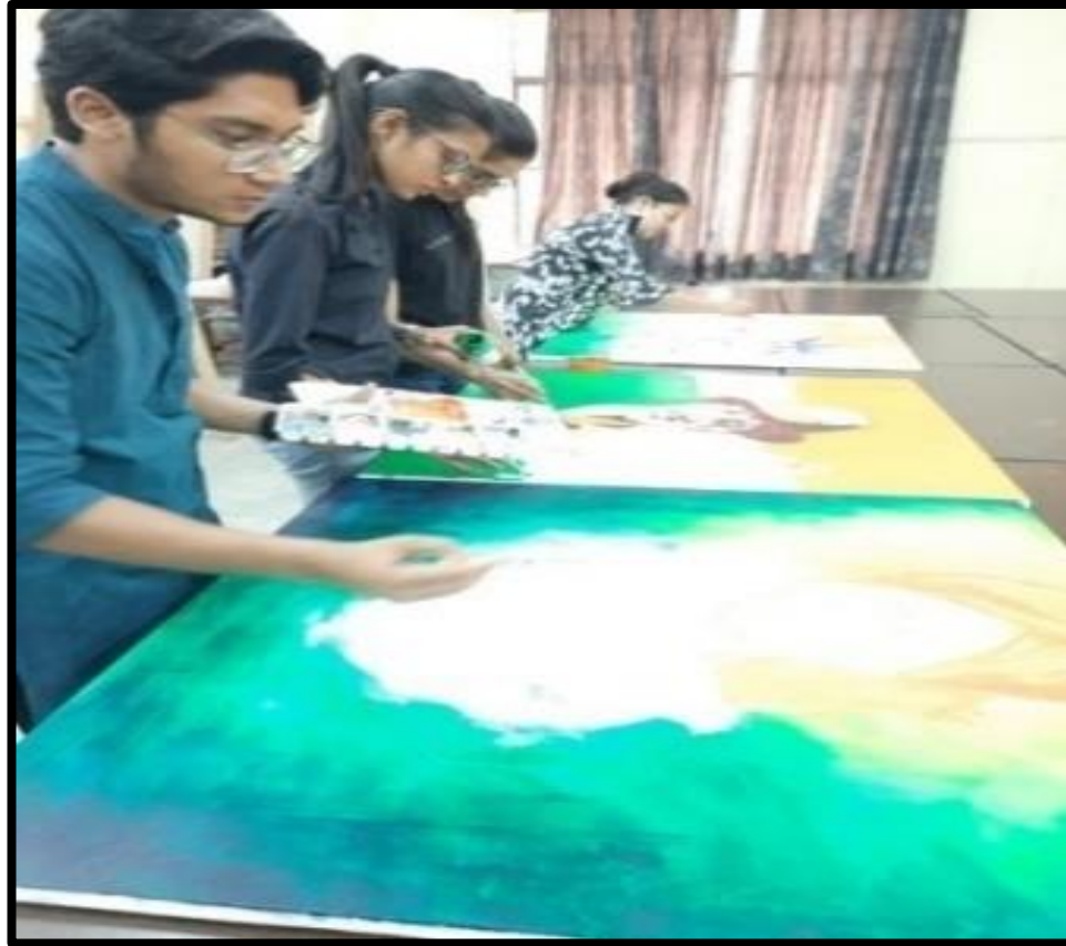
"75 Years of Independence" Inter College Painting Competition 02-04- 2021 Department of Fine Arts