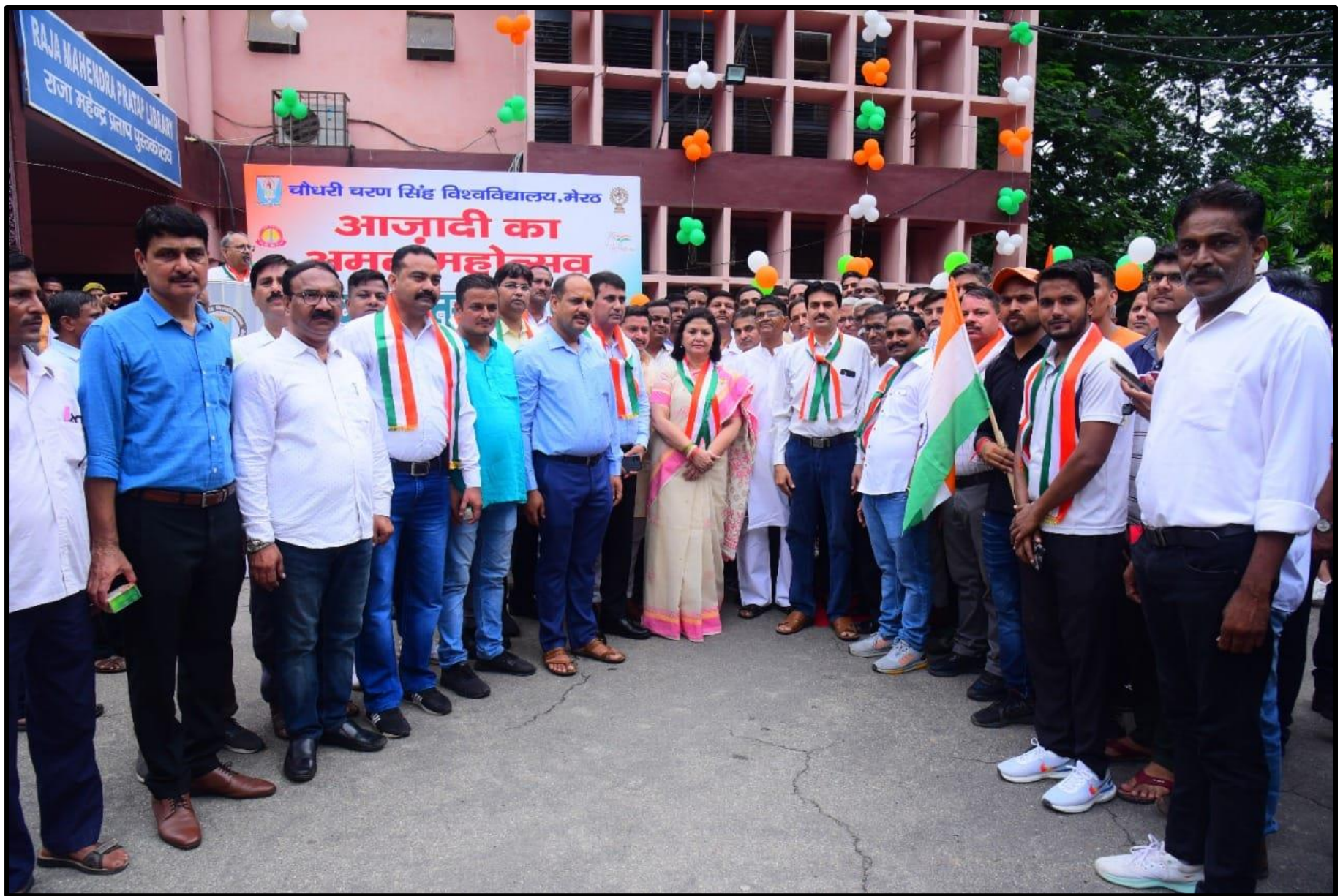
Independence day celebration in University campus 15-08-2022