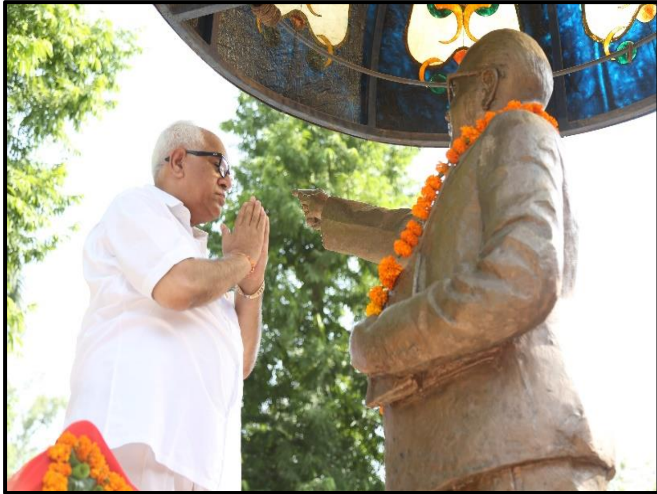
Independence day celebration in University campus 15-08-2017