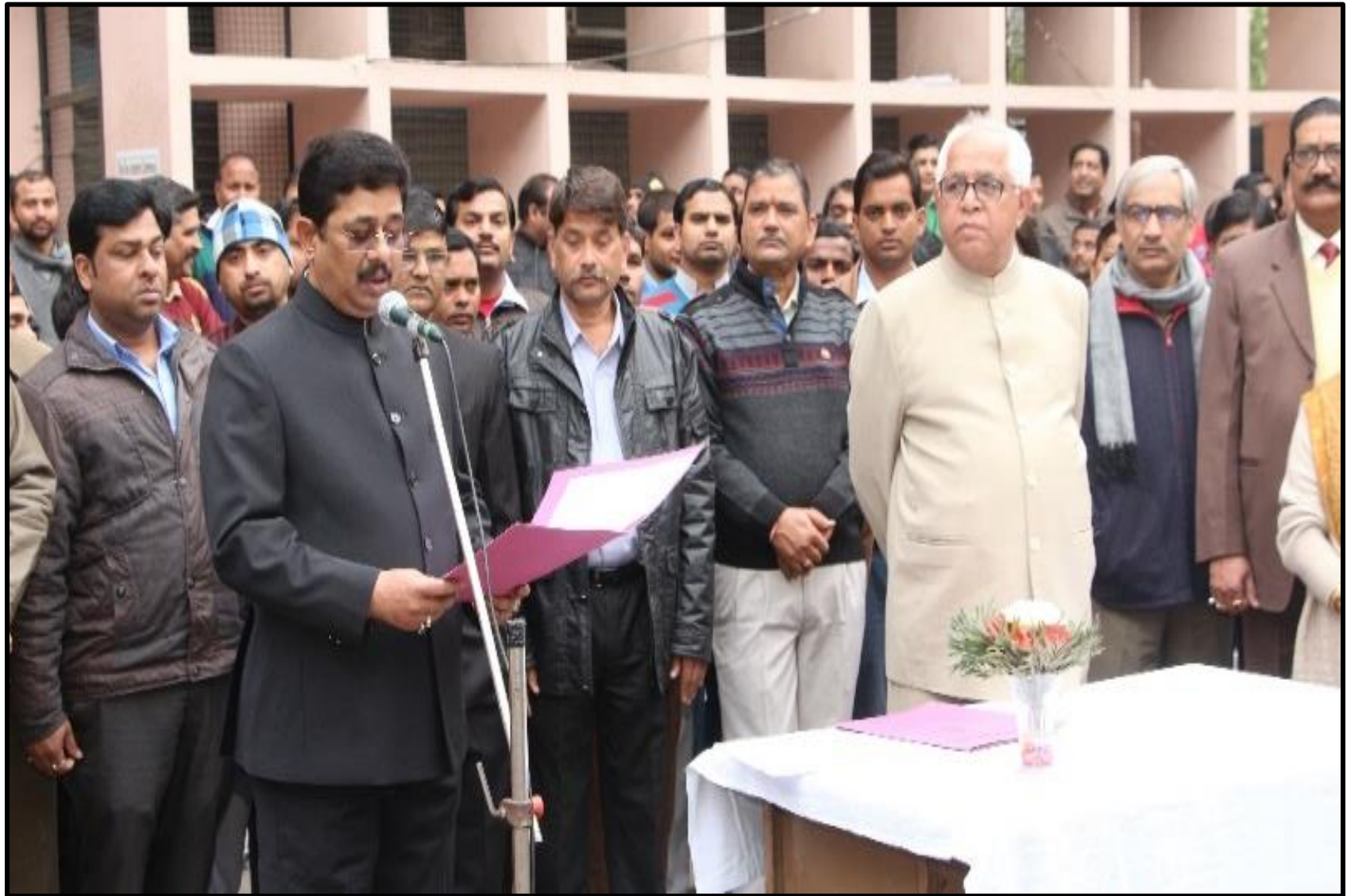
Independence Day Celebration in University Campus 26-01-2017