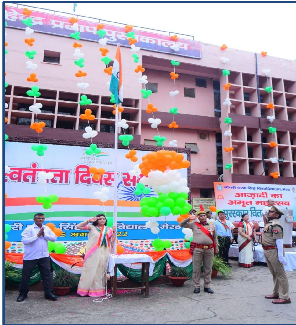
Independence day celebration in University campus 15-08-2022