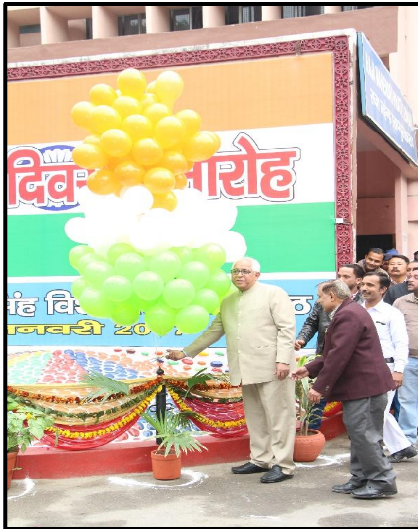
Independence Day Celebration in University Campus 26-01-2017