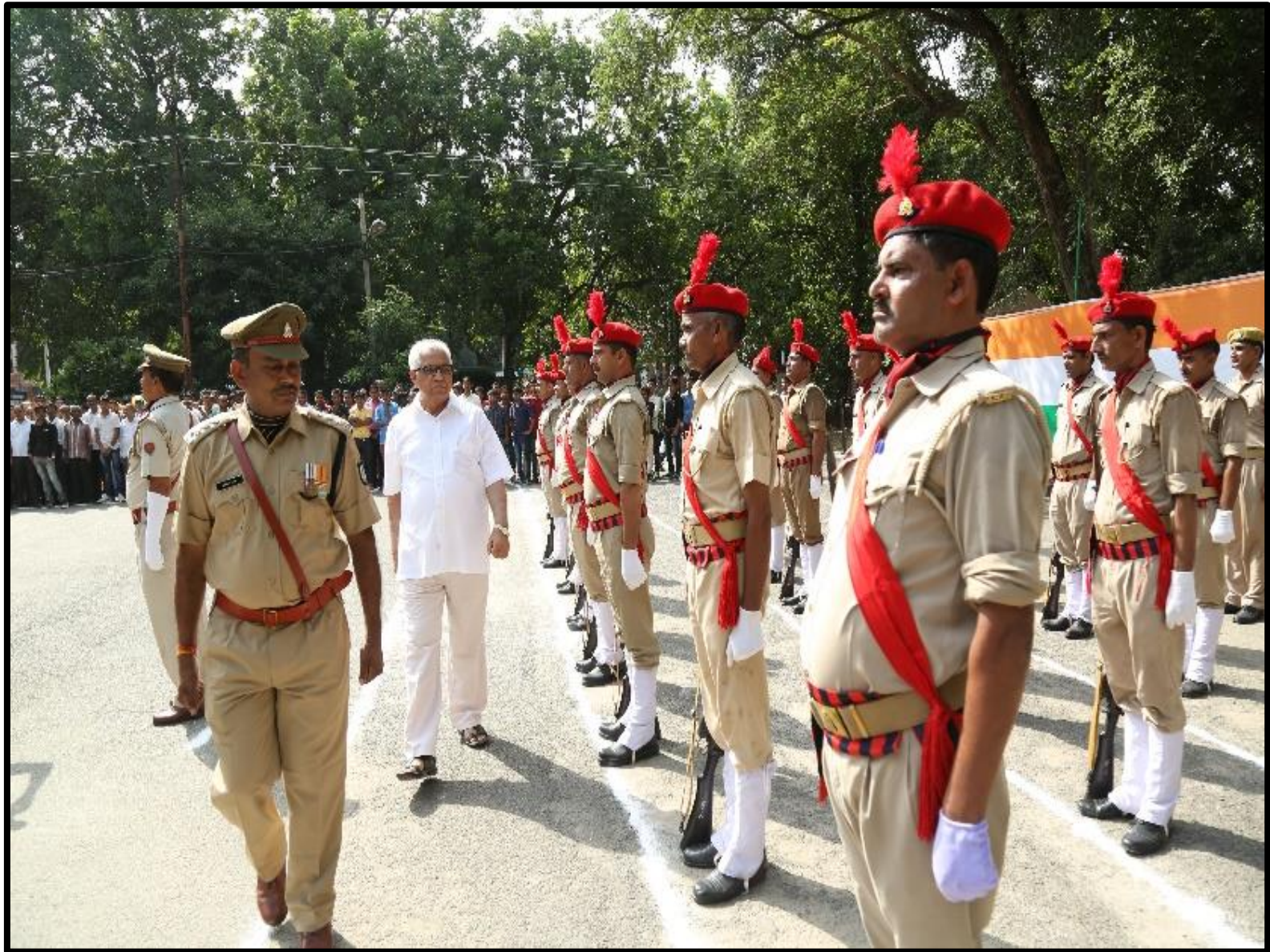
Independence day celebration in University campus 15-08-2017