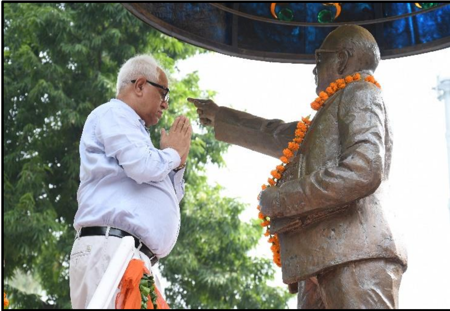
Independence Day Celebration in University Campus 15-08-2018