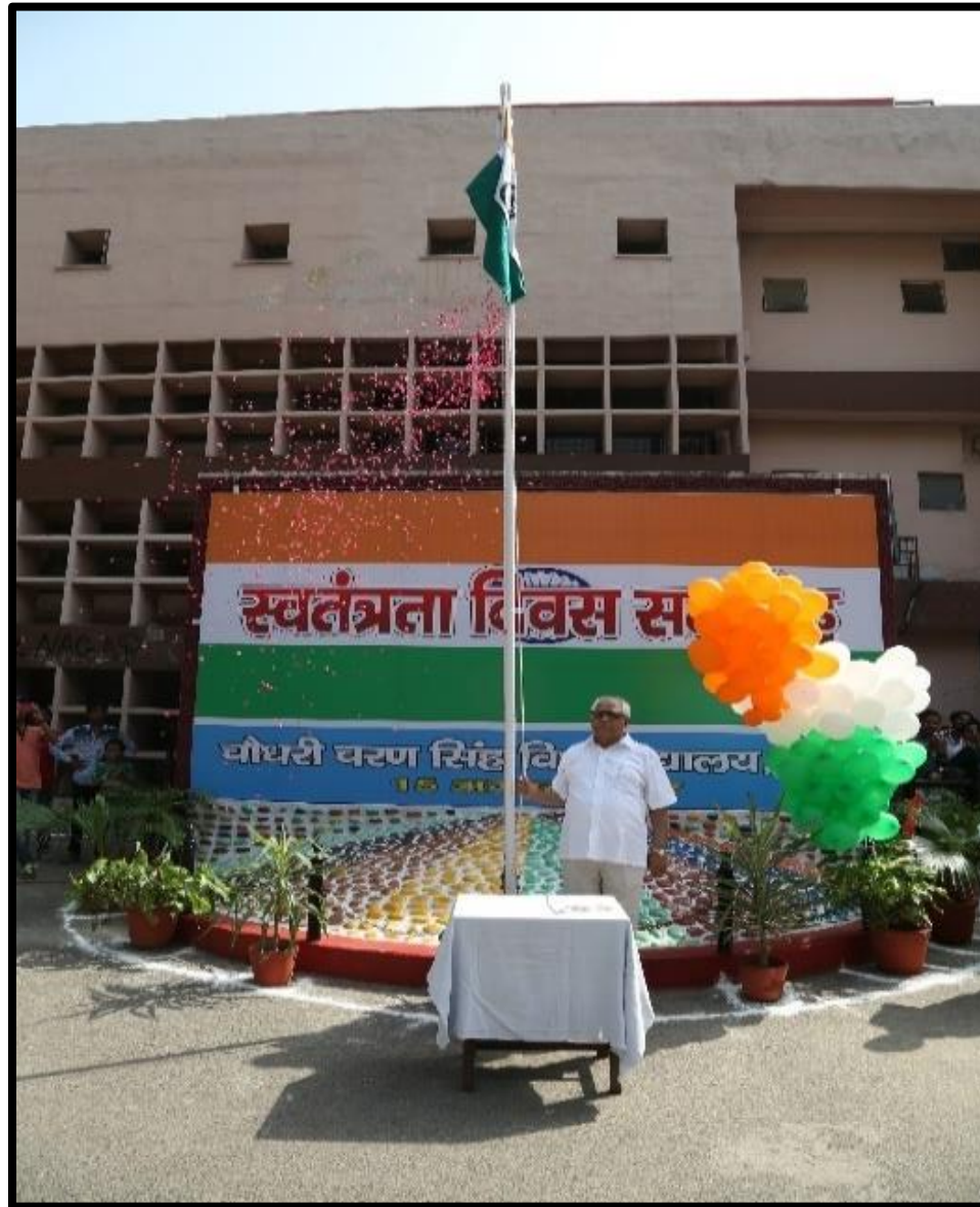
Independence day celebration in University campus 15-08-2017