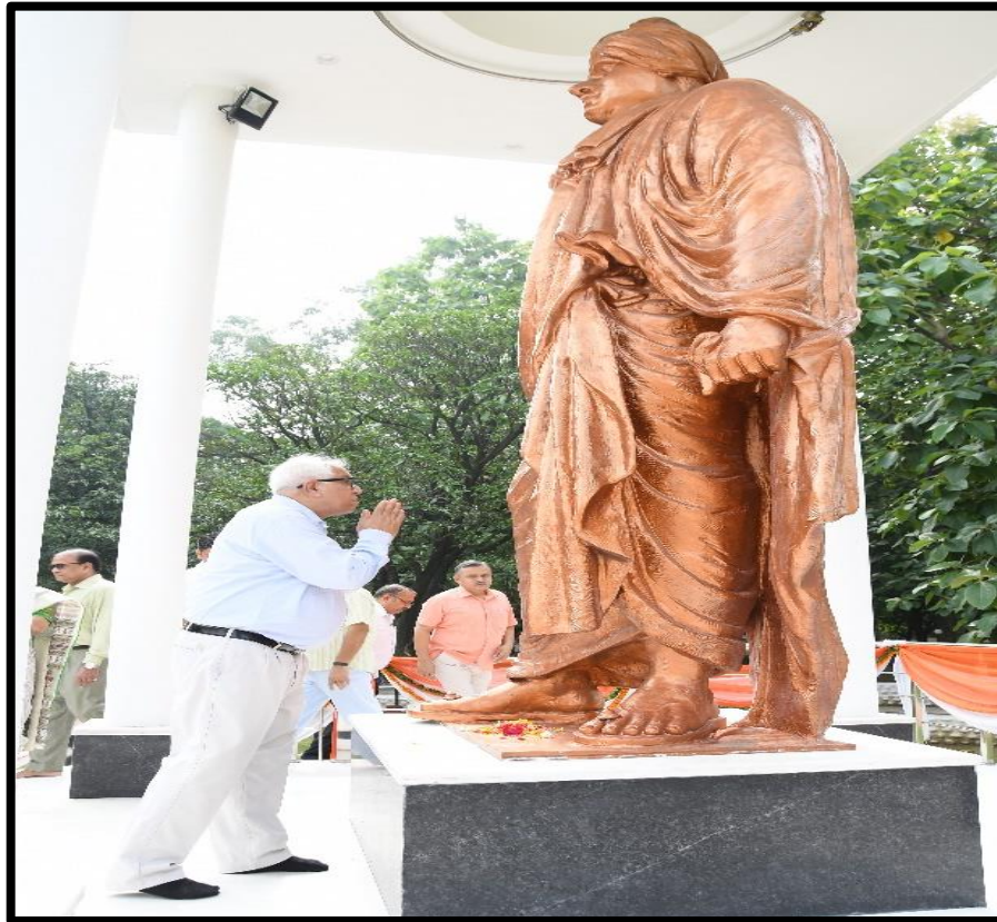
Independence Day Celebration in University Campus 15-08-2018