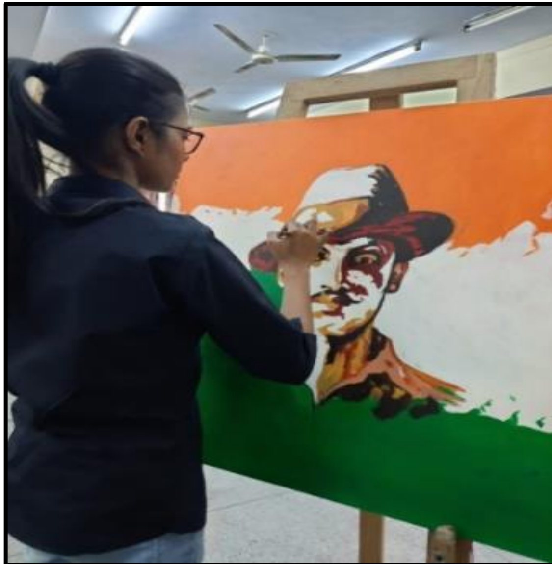
"75 Years of Independence" Inter College Painting Competition 02-04- 2021 Department of Fine Arts