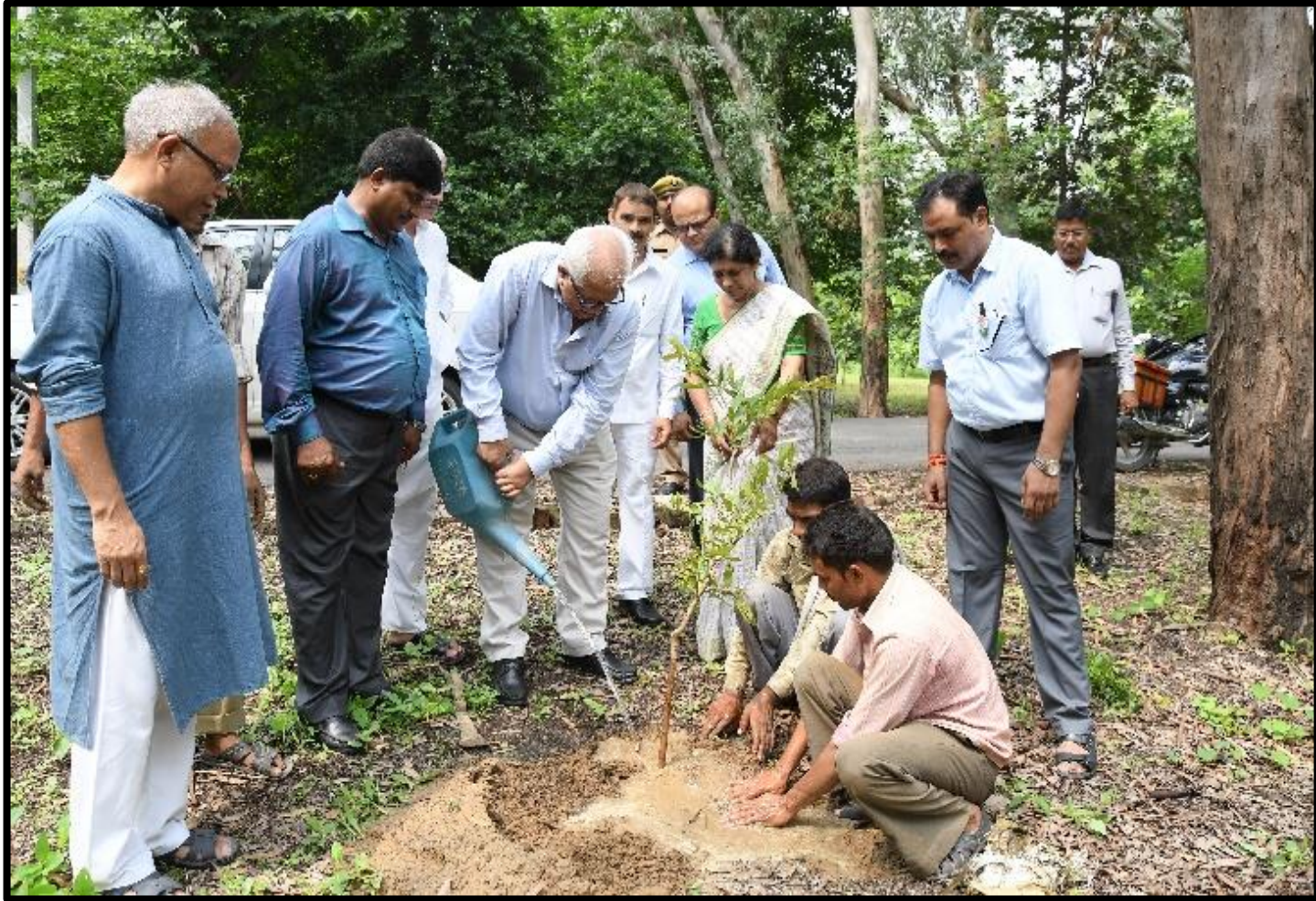
Independence Day Celebration in University Campus 15-08-2018