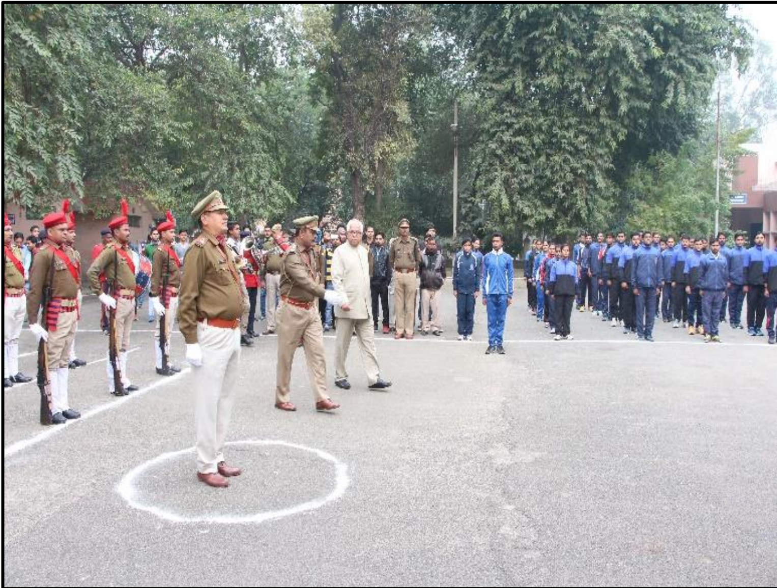
Independence Day Celebration in University Campus 26-01-2017