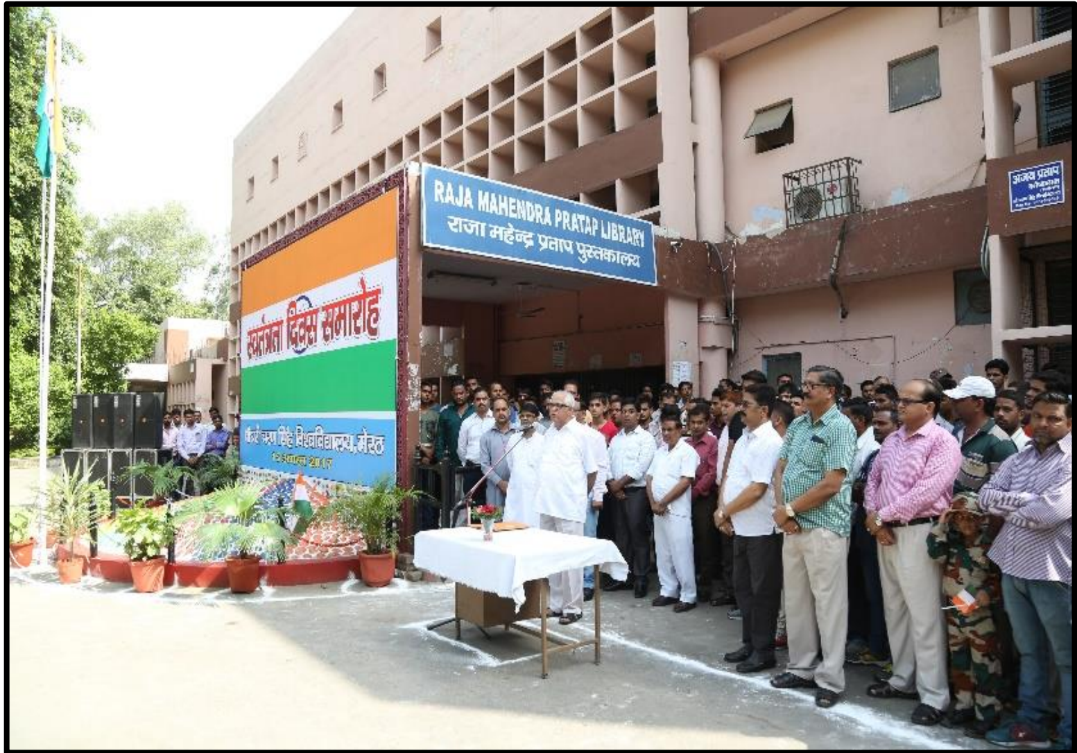
Independence day celebration in University campus 15-08-2017