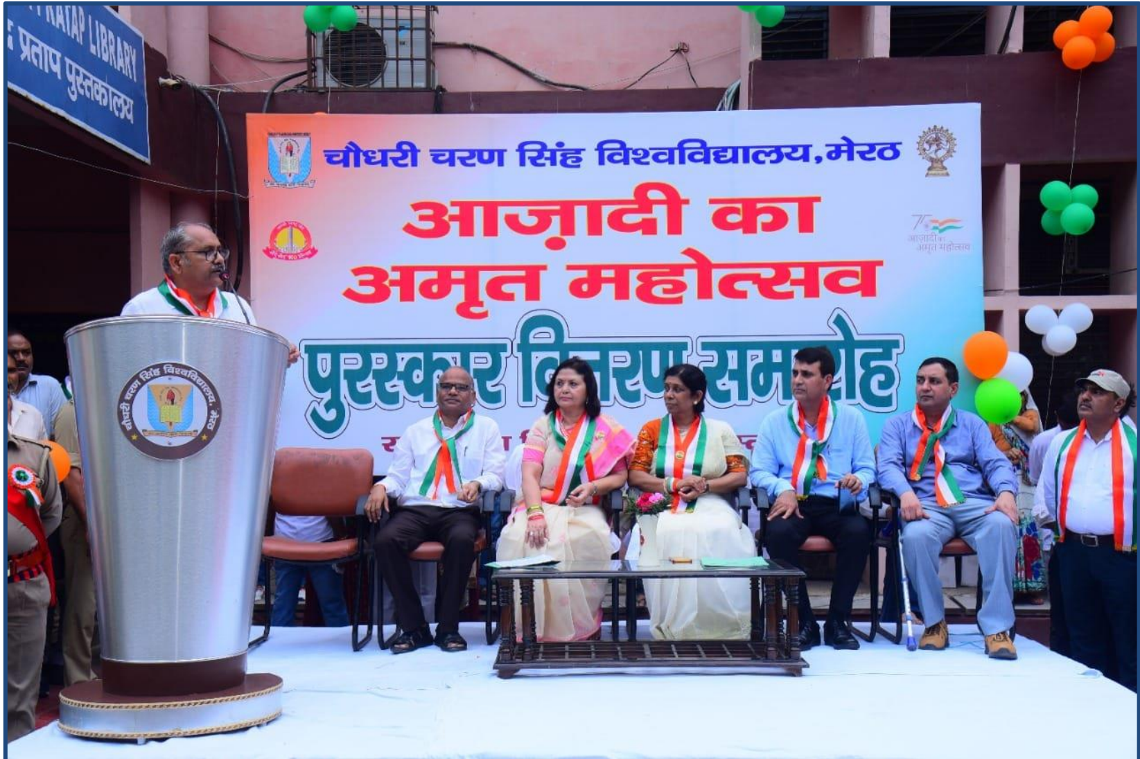
Independence day celebration in University campus 15-08-2022