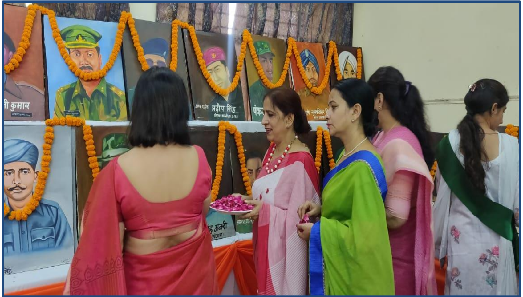
Independence day celebration in University campus 16-08-2022 Department of Fine Arts