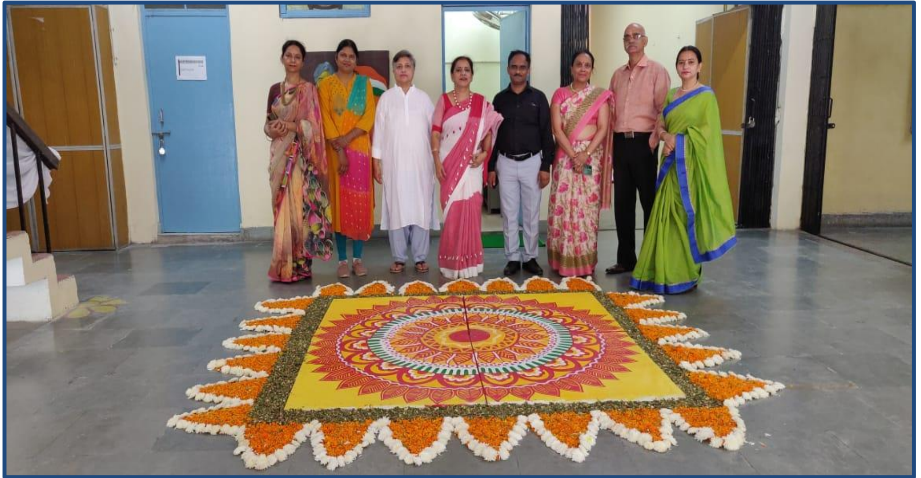
Independence day celebration in University campus 16-08-2022 Department of Fine Arts