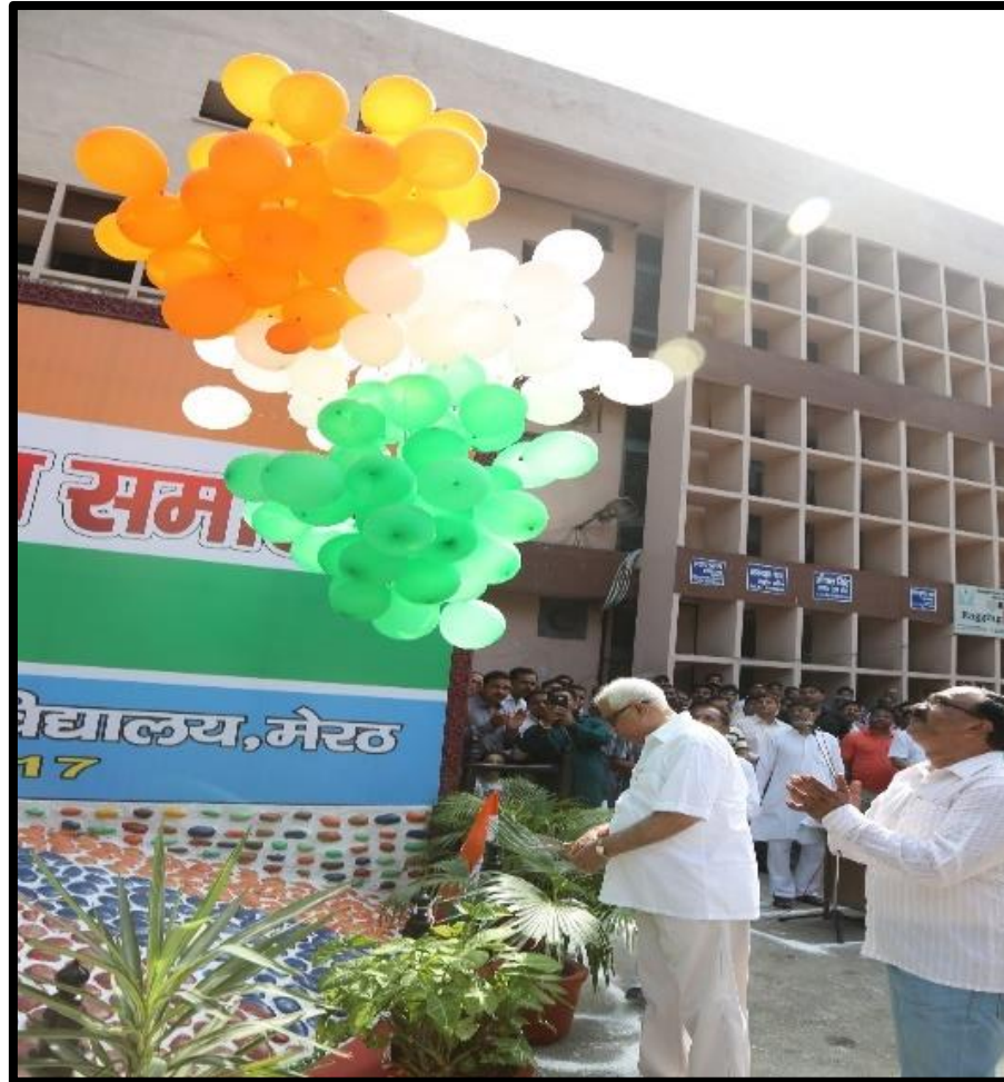
Independence day celebration in University campus 15-08-2017