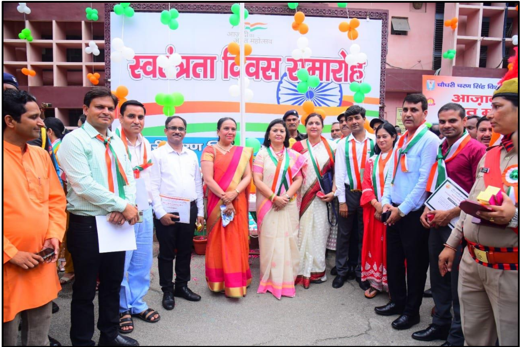
Independence day celebration in University campus 15-08-2022