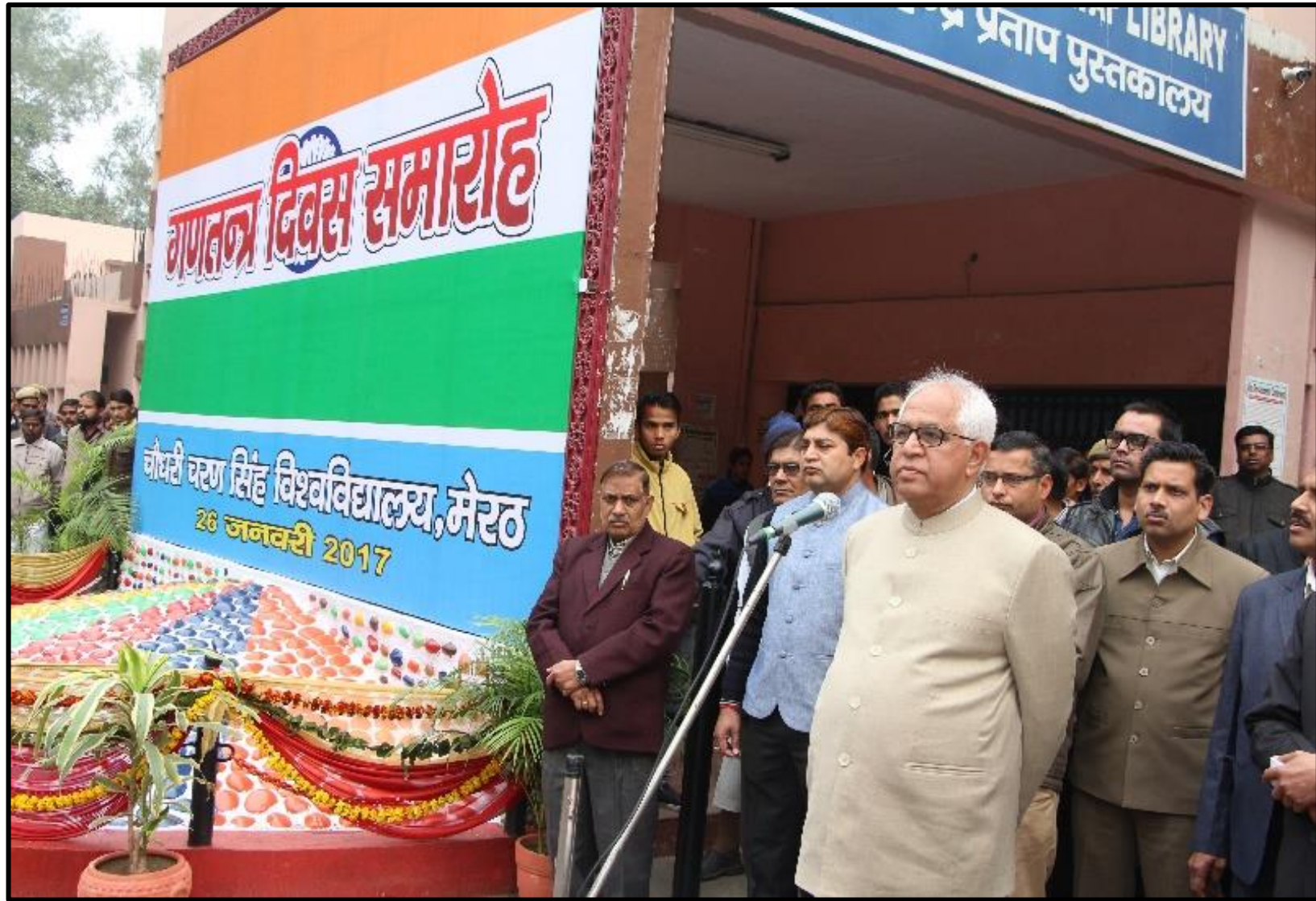
Independence Day Celebration in University Campus 26-01-2017