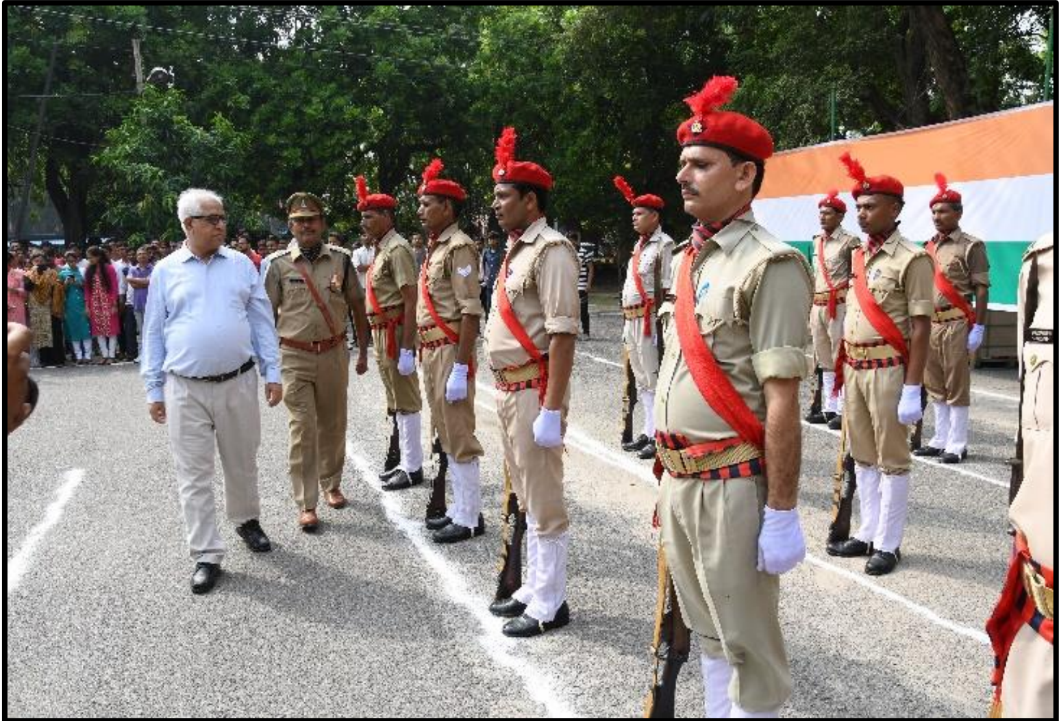
Independence Day Celebration in University Campus 15-08-2018