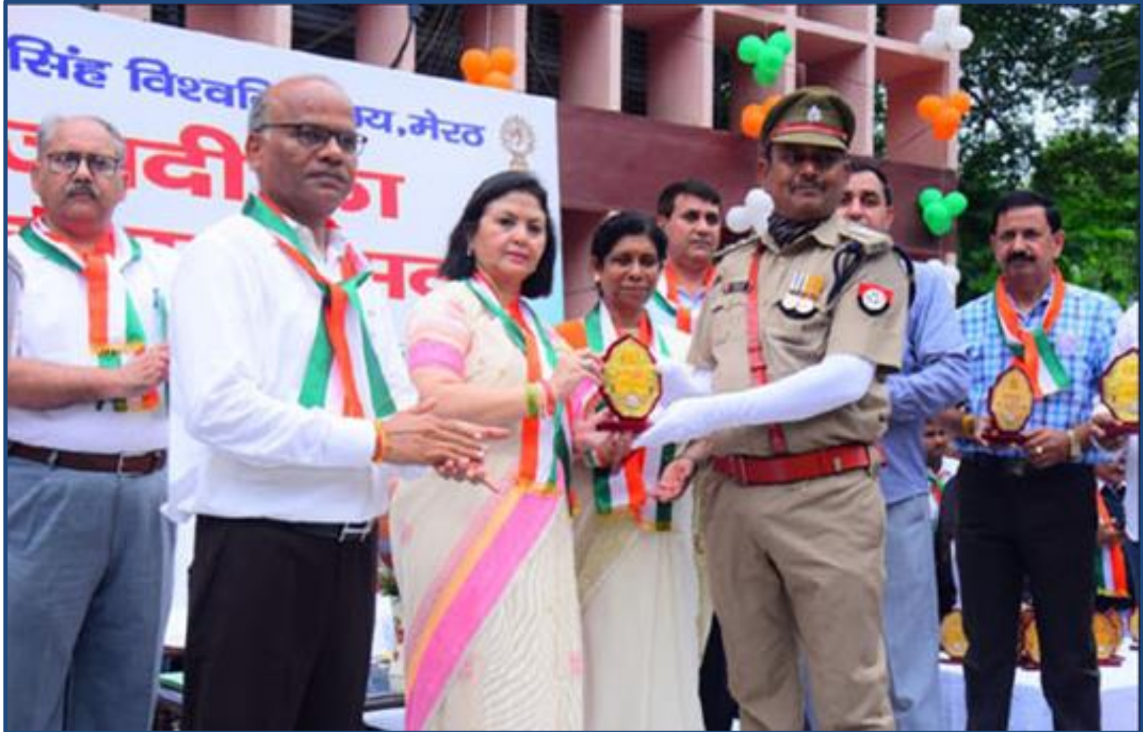
Independence day celebration in University campus 15-08-2022