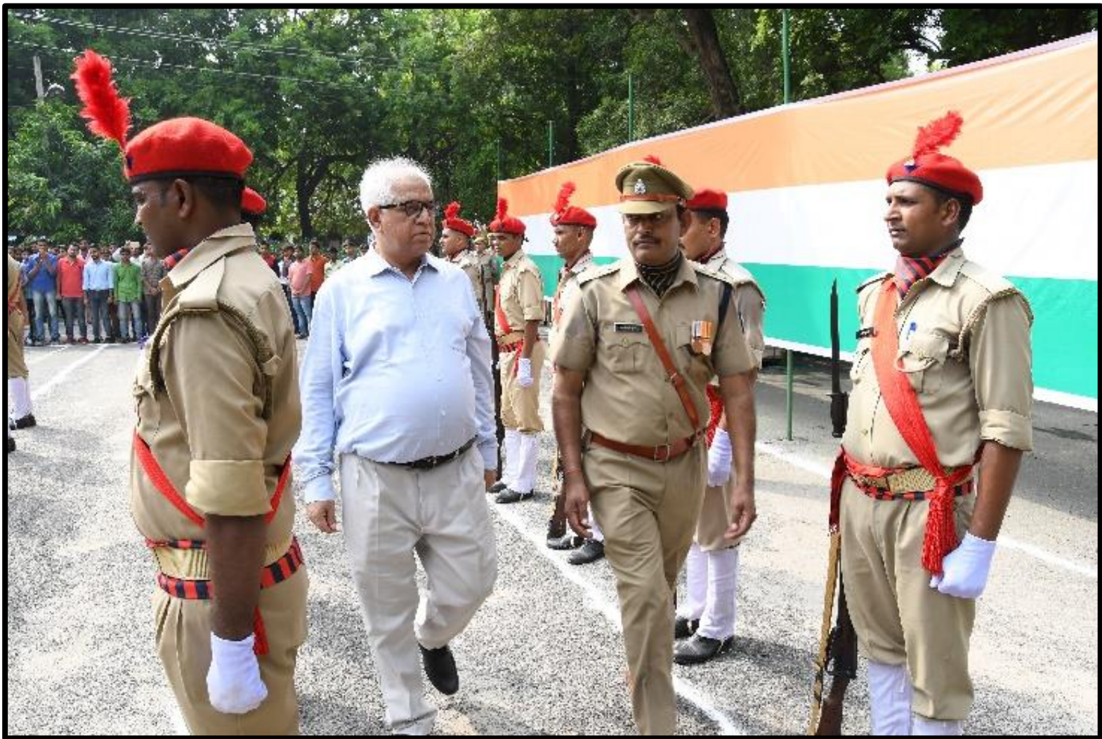
Independence Day Celebration in University Campus 15-08-2018